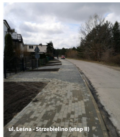
ul. Leśna - Strzebielino (etap II)

Zrealizowano zadanie inwestycyjne polegające na budowie chodnika na ul. Wejherowskiej w Strzebielinie - chodnik z pewnością ułatwi komunikację pieszą mieszkańców tzw. „Zajązkowa” w stronę centrum miejscowości a przede wszystkim zwiększy bezpieczeństwo pieszych poruszających się dotychczas poboczem drogi.