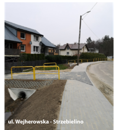
ul. Wejherowska - Strzebielino