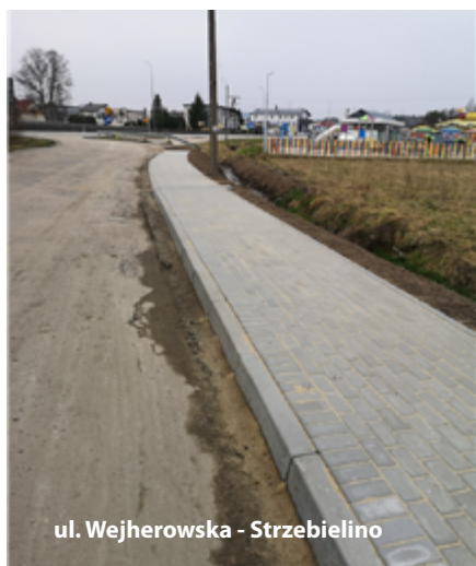
ul. Wejherowska - Strzebielino

Wartość inwestycji: 119 832,52 zł brutto