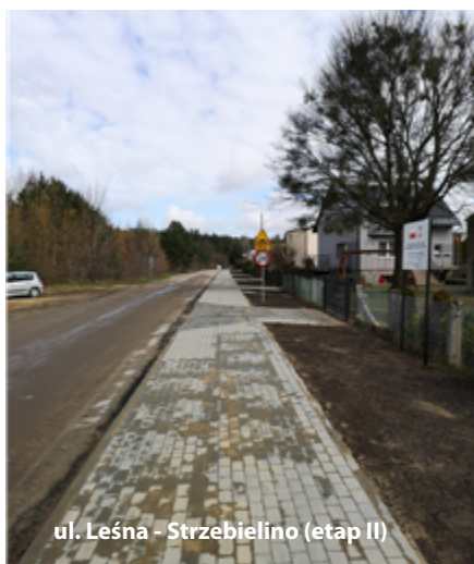
ul. Leśna - Strzebielino (etap II)

Projekt współfinansowany z Funduszu Dróg Samorządowych – kwota dofinansowania: 67 149,00 zł