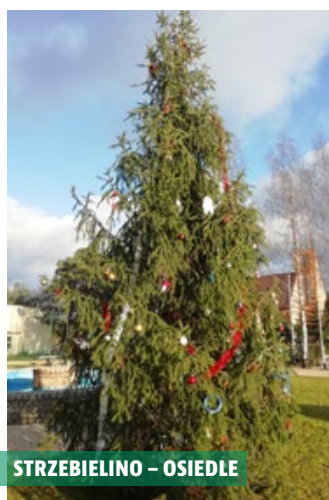
STRZEBIELINO - OSIEDLE