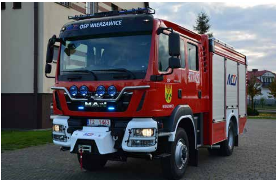
ŚREDNI SAMOCHÓD RATOWNICZO-GAŚNICZY - OSP WIERZAWICE