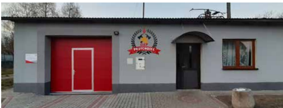
BUDYNEK STRAŻNICY OSP PRZYCHOJEC