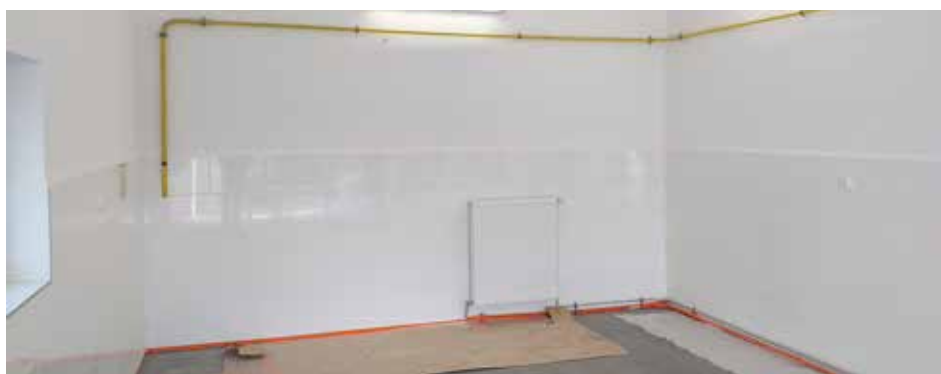
ZMODERNIZOWANY GARAŻ W JEDNOSTCE OSP PISKOROWICE