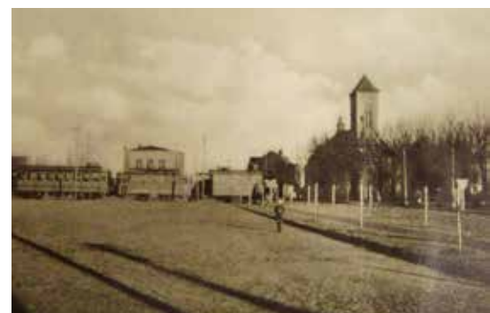
Dzisiejszy pl. Kościuszki, ok. 1940 r.