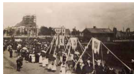
Dzisiejszy pl. Kościuszki, ok. 1918 r.

Na podstawie: „Konstantynów Łódzki. Dzieje miasta”, pod red. Marii Nartowicz-Kot, Łódź 2006.