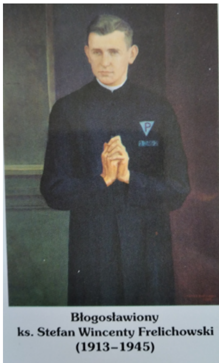
Błogosławiony ks. Stefan Wincenty Frelichowski (1913–1945)