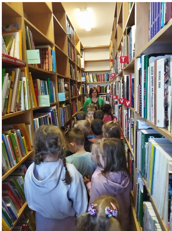
Dzieci zwiedzają Bibliotekę