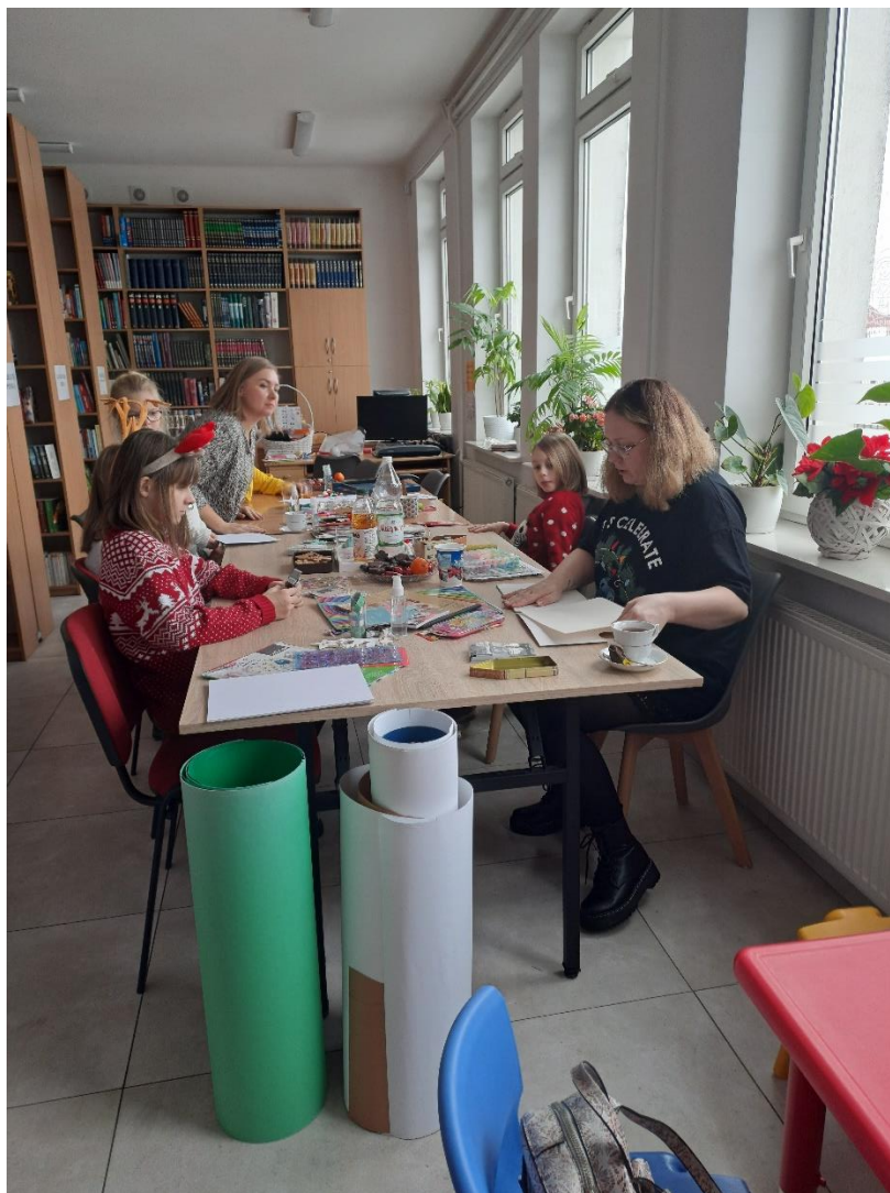
Warsztaty z robienia kartek świątecznych