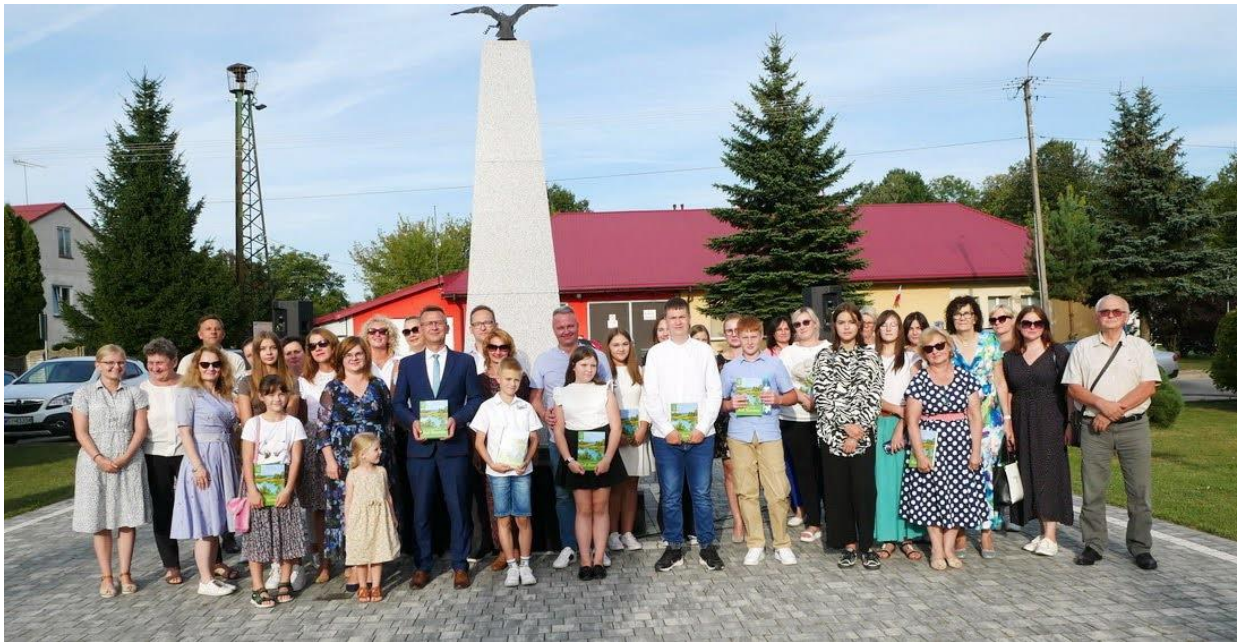
Narodowe Czytanie w Skórcu