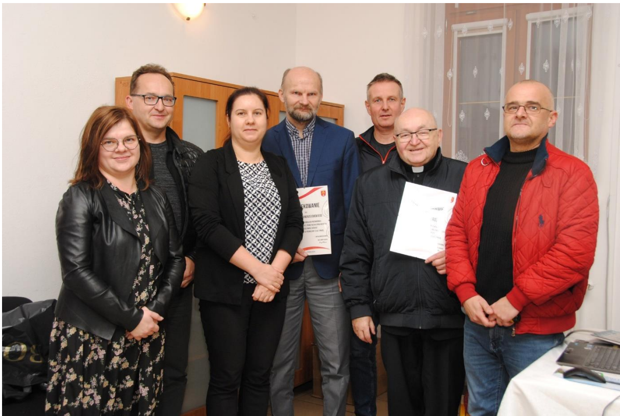
Spotkanie promocyjne książki „Z Drozdem i Zbirkiem przez ziemię naznaczoną Krzyżem, czyli rajd po gminie Skórzec”