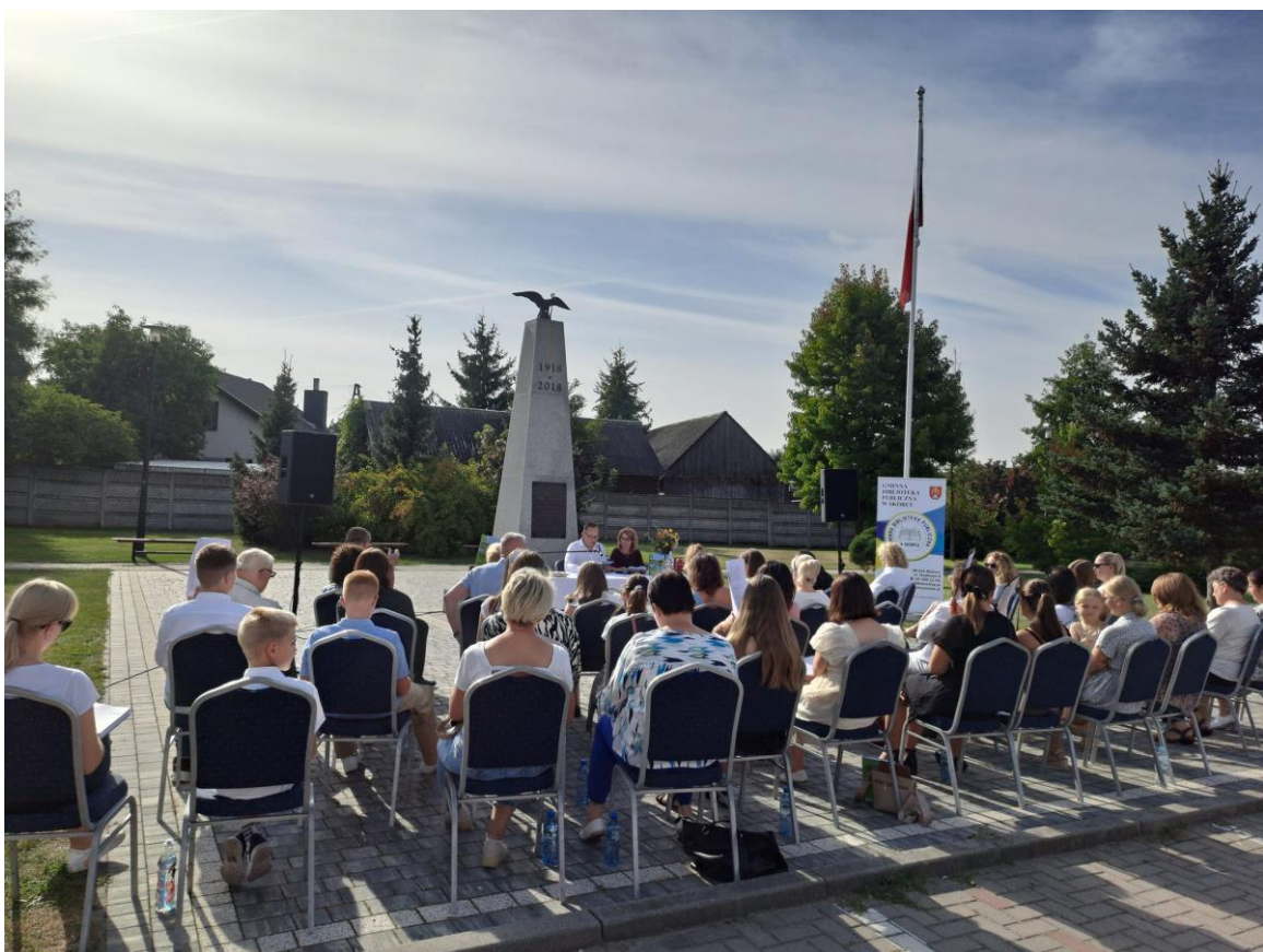
Narodowe Czytanie na skwerku w Skórcu