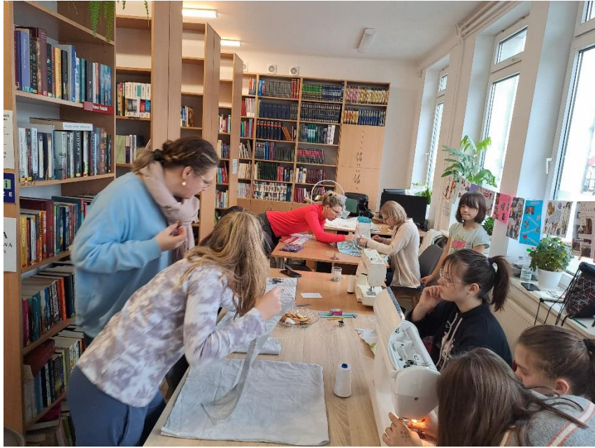
Warsztaty „Pierwsze kroki w szyciu”