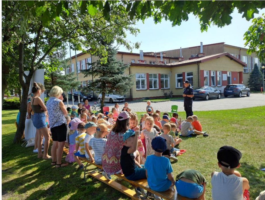
Projekt „Bezpieczne wakacje z Kicią Kocią”