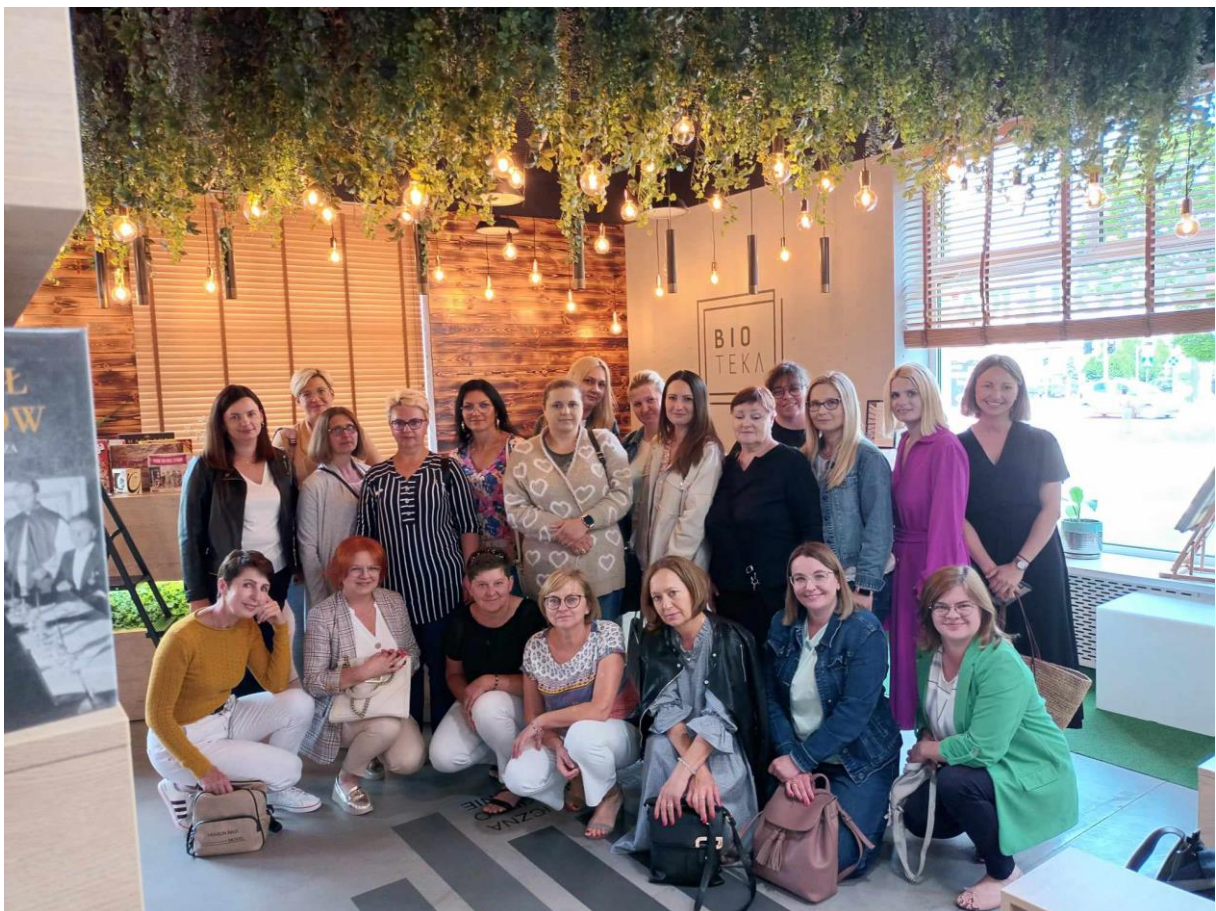
Wycieczka bibliotekarzy powiatu siedleckiego