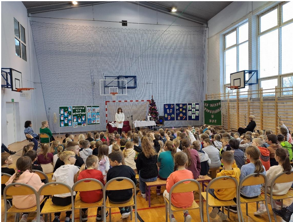
Spotkanie autorskie z Jedytą Piskorz „Wigilia w opałach”