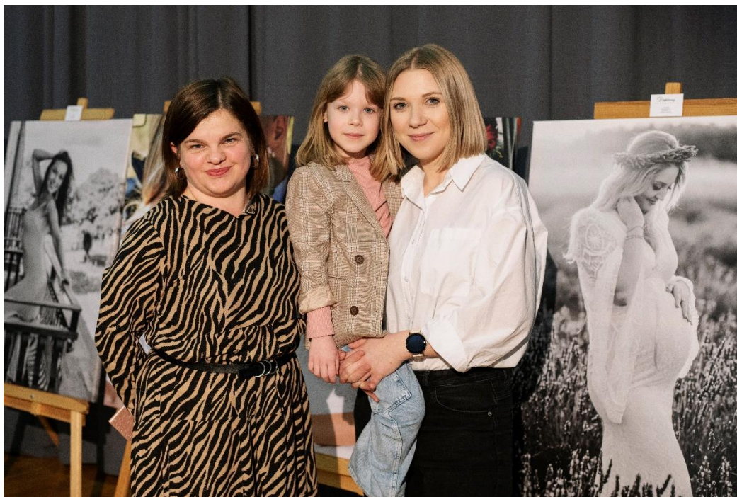
Wystawa fotograficzna „Kobiecość” z okazji Gminnego Dnia Kobiet.