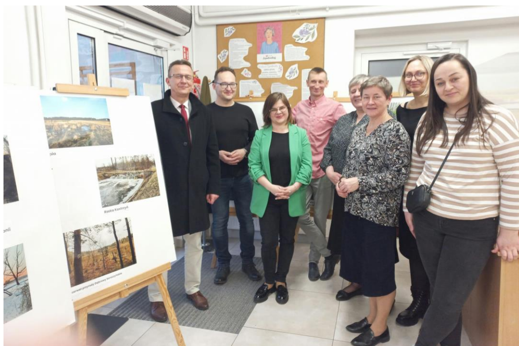
Wystawa fotograficzna Tomasza Skóry w Bibliotece „Tam gdzie kończy się asfalt, zaczyna się przygoda”