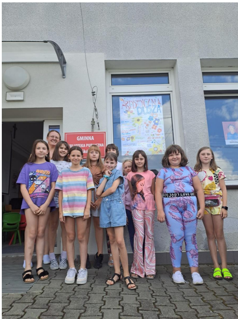
Wakacyjne warsztaty „Odkryj pasję” – jedna z grup.