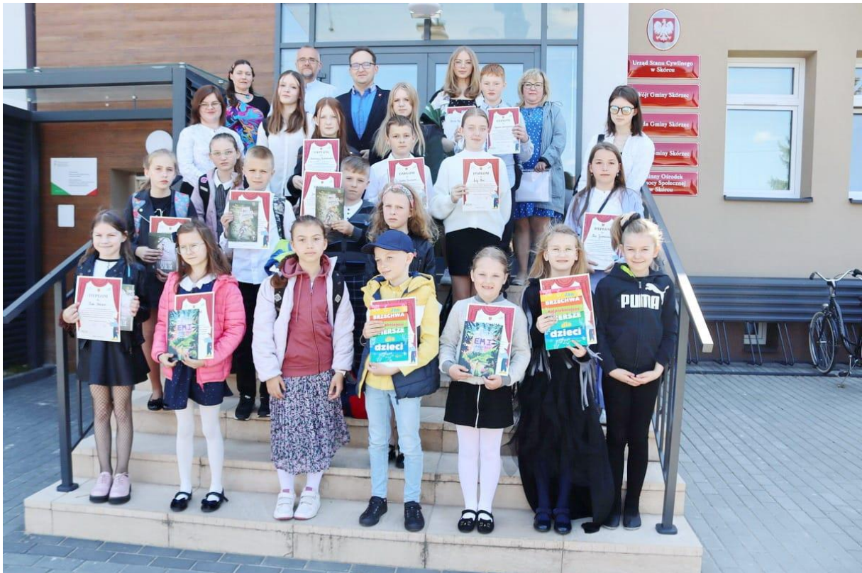
Eliminacje gminne Konkursu recytatorskiego dla dzieci im. K. Makuszyńskiego