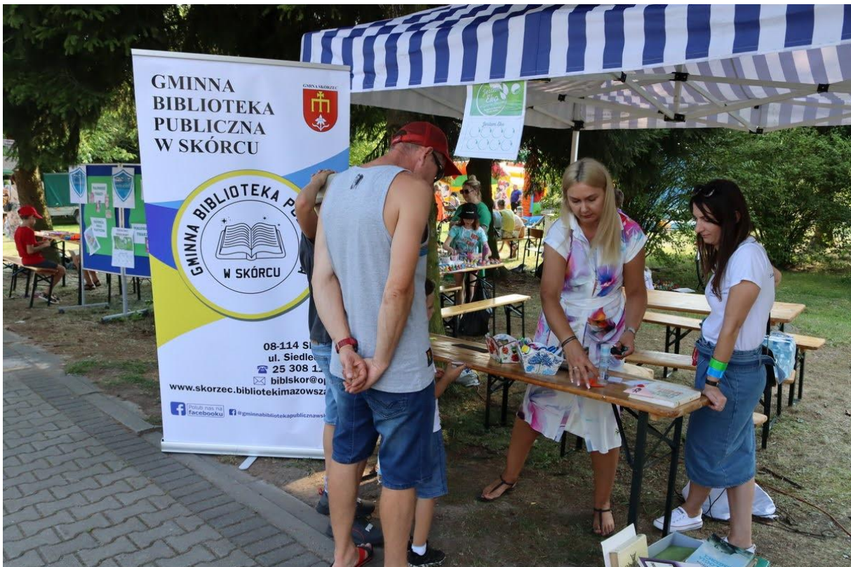
Biblioteka w plenerze – na Ekopikniku w Skórcu