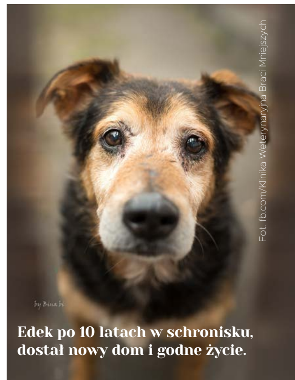
Edek po 10 latach w schronisku, dostał nowy dom i godne życie.

Rasa tak naprawdę nie ma znaczenia. Każdy pies może okazać się naszym najlepszym przyjacielem.