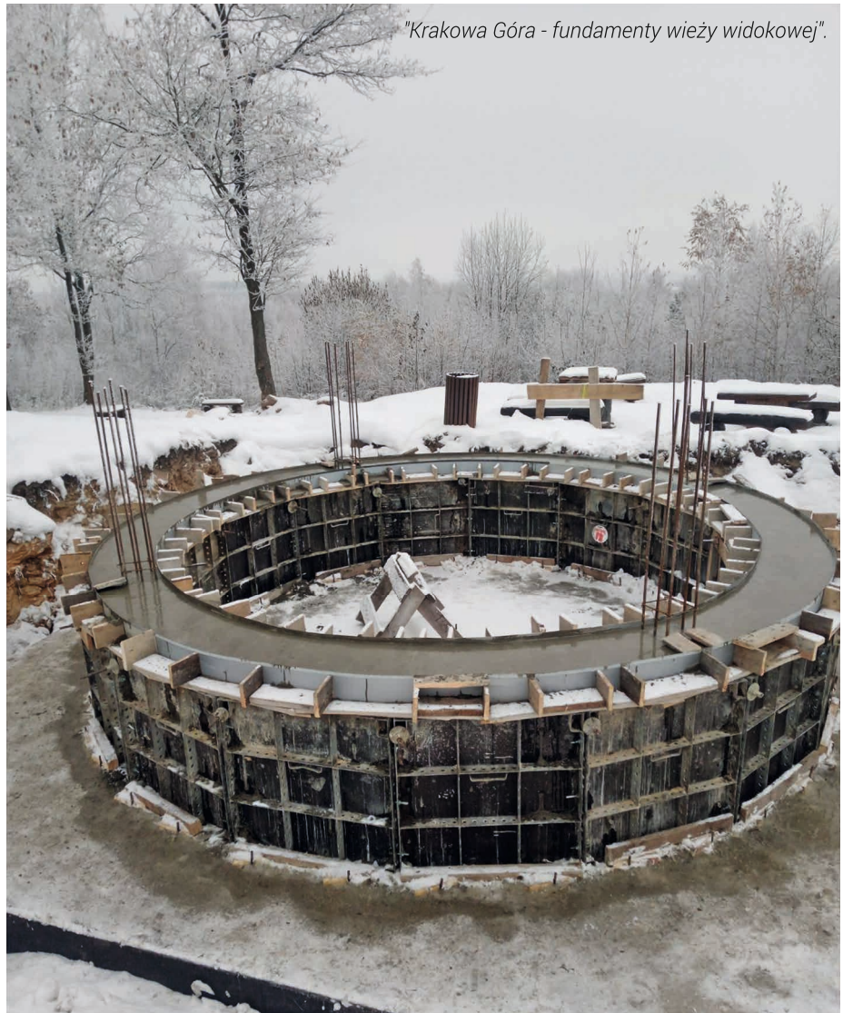
"Krakowa Góra - fundamenty wieży widokowej".

tys. zł, modernizacja ciągów pieszych w Ruskowicach – 100 tys. zł, modernizacja systemu odwodnienia drogi gminnej ul. Stawowa w Borkowicach – 122 tys. zł, wymiana systemu ogrzewania w budynku gminnym w Rzućowie – 40 tys. zł, poprawa efektywności energetycznej gminnych obiektów użyteczności publicznej – 433 tys. zł, zakup kosiarki – 20 tys. zł, projekt rozbudowy oświetlenia w Woli Kuraszowej i Borkowicach – 20 tys. zł, z Budżetu Obywatelskiego Mazowsza MZDW zmodernizuje odcinek chodnika przy drodze Wojewódzkiej 727 w Ninkowie – 200 tys. zł. Na realizację programów asystent osobisty osoby z niepełnosprawnością i opiekę wy-