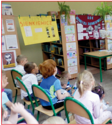
„CAŁA POLSKA CZYTA DZIECIOM” MAJOWE SPOTKANIA Z KSIĄŻKĄ str. 4