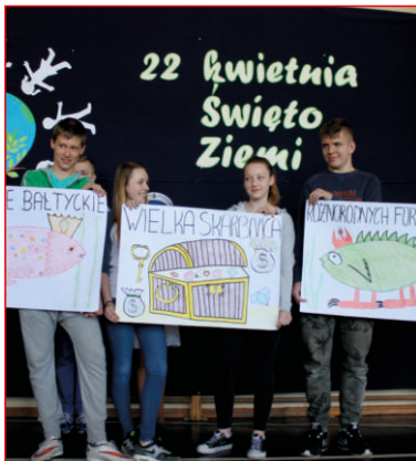
DZIEŃ ZIEMI W ZESPOLE SZKÓŁ W BOŻYMPOLU WIELKIM str. 7