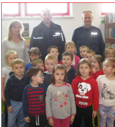
KWIECIEŃ W SŁONECZNYM PRZEDSZKOLU str. 6