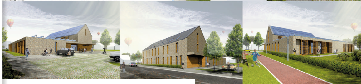
BUDYNEK URZĘDU GMINY W ŁĘCZYCACH