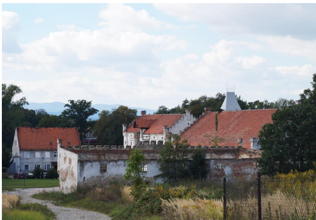
Zespół folwarków Dolnego i Górnego wraz z założeniem ogrodowym i relikdami zamku