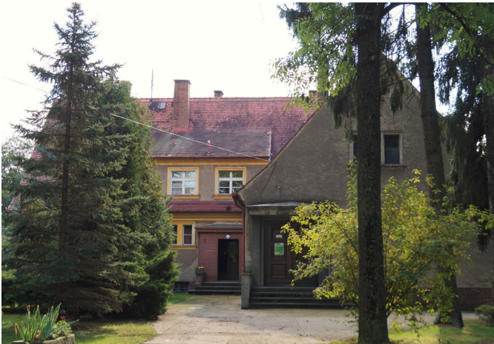
Szkoła, obecnie świetlica wiejska