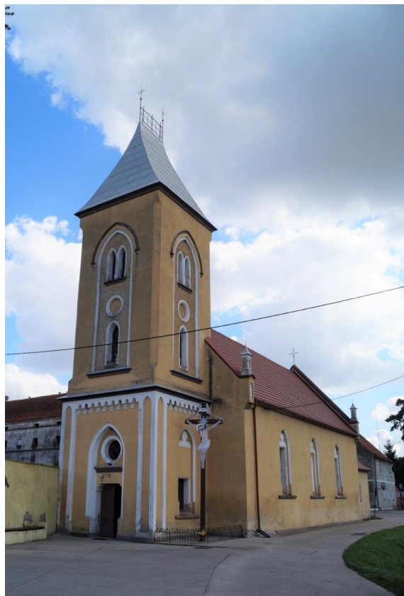
Rzymskokatolicki kościół filialny pw. św. Jana Nepomucena z 1747 r.,