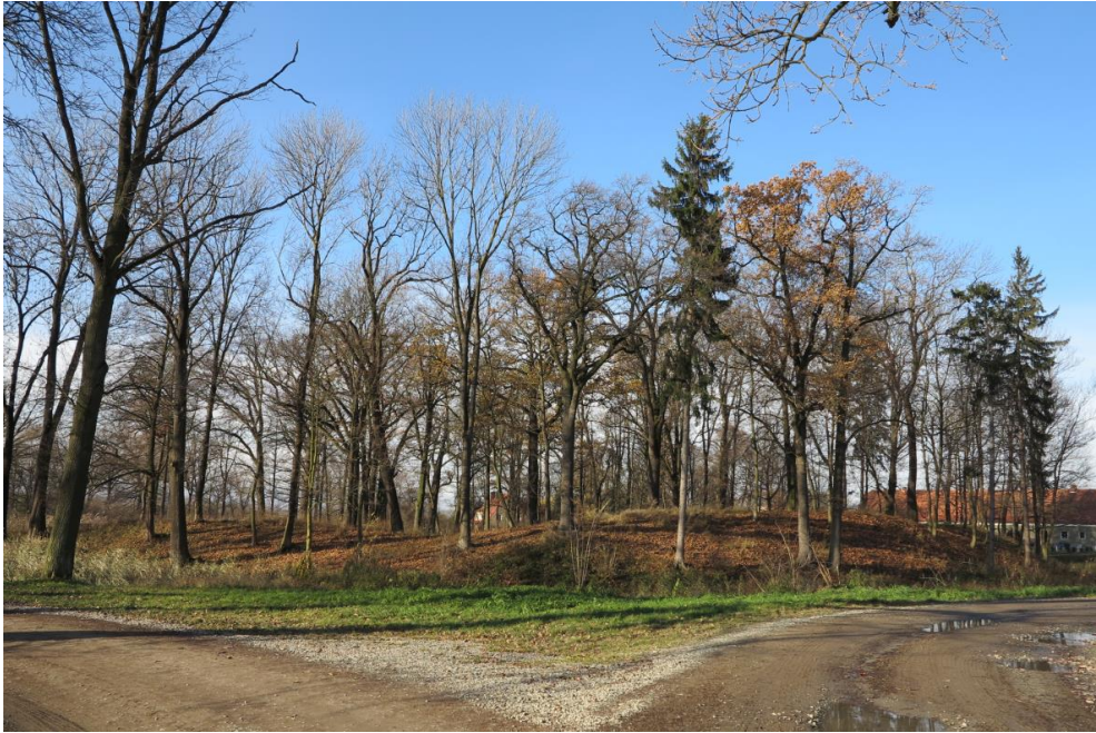
Grodzisko średniowieczne – relikty zamku