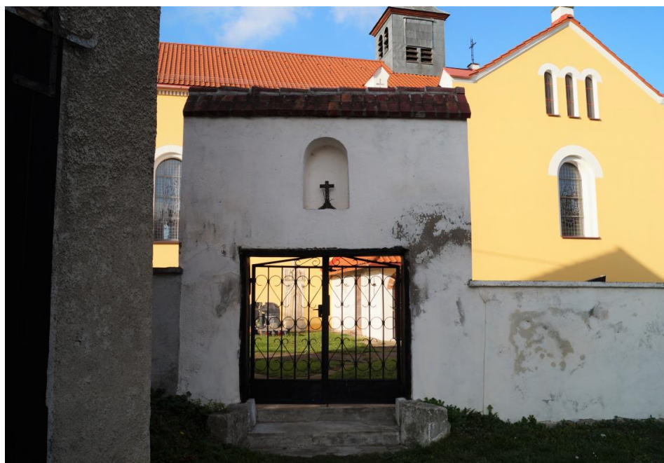
Brama II w ogrodzeniu cmentarza przy rzymskokatolickim kościółce parafialnym pw. św. Katarzyny