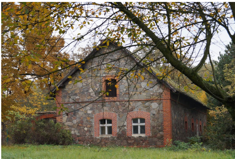
Budynek gospodarczy przy plebanii rzymskokatolickiego kościoła parafialnego pw. św. Katarzyny