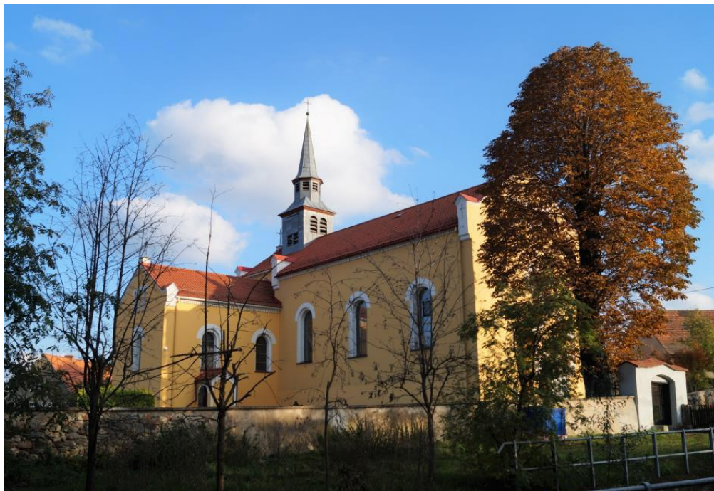
Zespół rzymskokatolickiego kościoła parafialnego pw. św. Katarzyny z widokiem na bramę I (zachodnia)