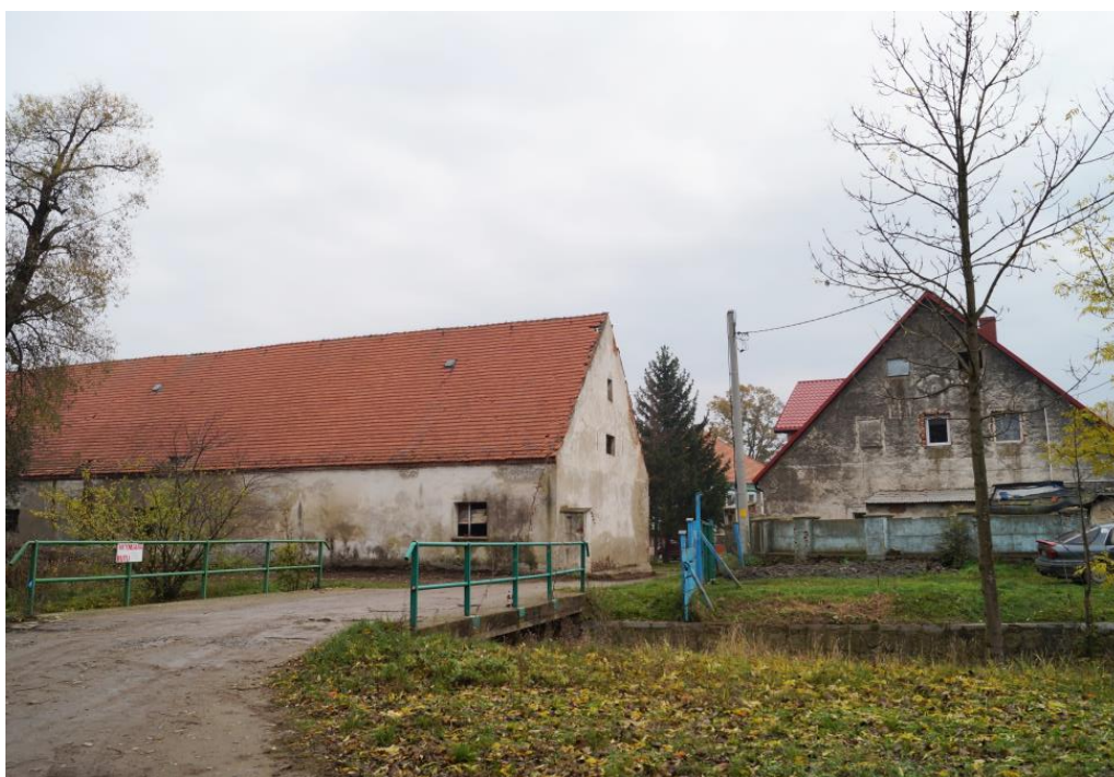
Zespół folwarku Dolnego (XVII-XIX w.)