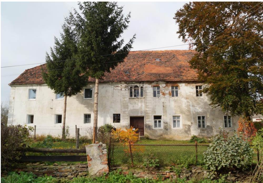
Karczma, obecnie dom mieszkalny