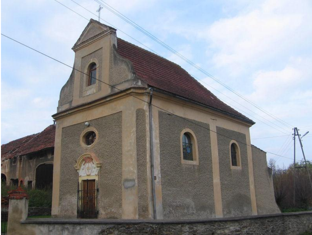
Rzymskokatolicka kaplica mszalna pw. św. Józefa Oblubieńca NMP