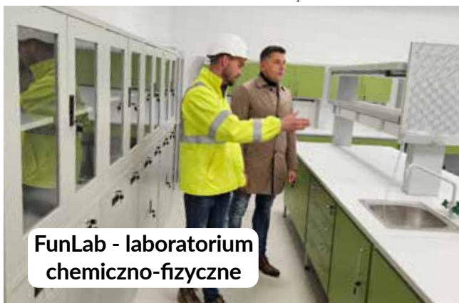
FunLab - laboratorium chemiczno-fizyczne