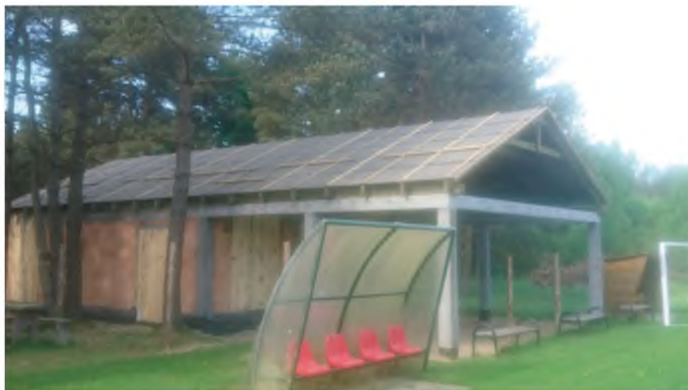
8. II etap budowy zaplecza sportowego boiska w Rozłazinie