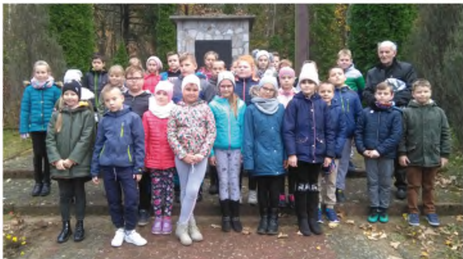
Wychowawczynie klas trzecich

ją wiedzą, dodatkowo prezentując różne artykuły oraz publikacje związane z tym miejscem, w wielu przypadkach swojego autorstwa. Wszyscy bardzo dojrzałe zachowali się podczas wspólnych chwil śladami historii naszych przodków. Akcja miała na celu rozbudzenie wśród najmłodszych uczniów postaw patriotycznych i uczczenie setnej rocznicy odzyskania niepodległości przez Polskę.