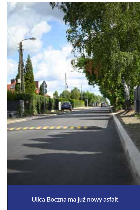
Ulica Boczna ma już nowy asfalt.