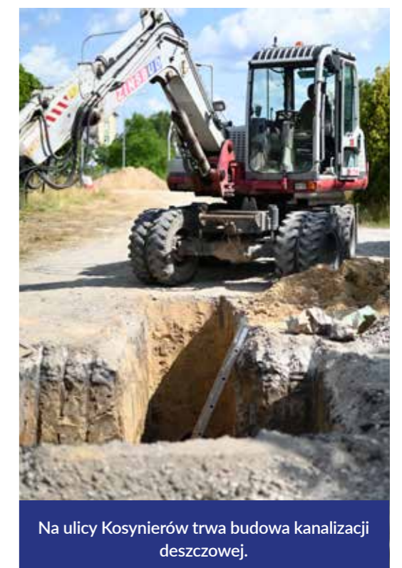
Na ulicy Kosynierów trwa budowa kanalizacji deszczowej.

- Od wielu lat środowiska sportowe zgłaszały potrzebę remontu hali i dostosowania jej do różnych dyscyplin sportu. Dzisiaj z radością możemy zrealizować te potrzeby równocześnie i na naprawdę wysokim poziomie - mówi Michał Szymczak.