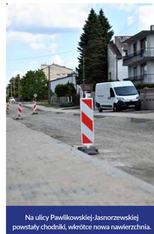
Na ulicy Pawlikowskiej-Jasnorzewskiej powstały chodniki, wkrótce nowa nawierzchnia.