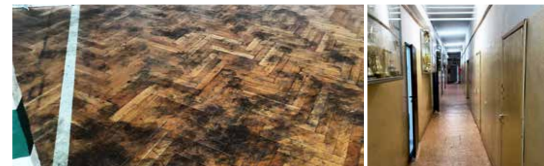
Parkiet oraz pomieszczenia treningowe i socjalne hali sportowej wymagają pilnego remontu.