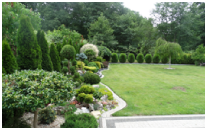
Zagroda NIEROLNICZA - I miejsce - A. D Kupc - Łęczyce