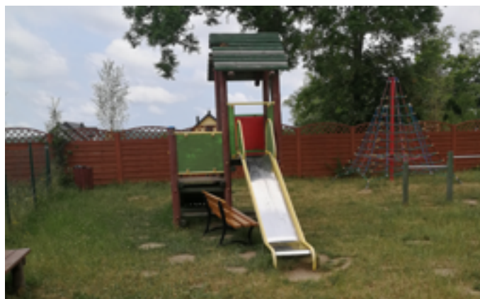
Kategoria Wieś-I miejsce - Kaczkowo