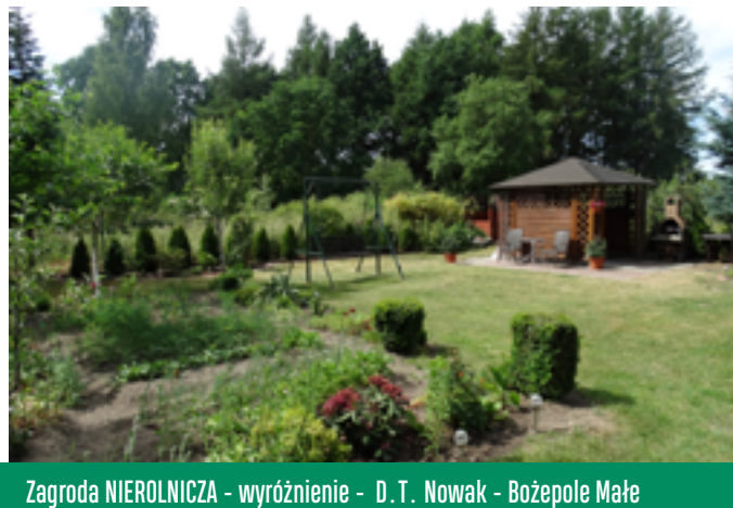
Zagroda NIEROLNICZA - wyróżnienie - D.T. Nowak - Bożepole Małe