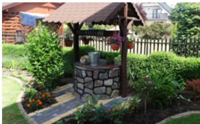
Zagroda NIEROLNICZA - wyróżnienie - U. R. Streng - Strzebielino - Osiedle