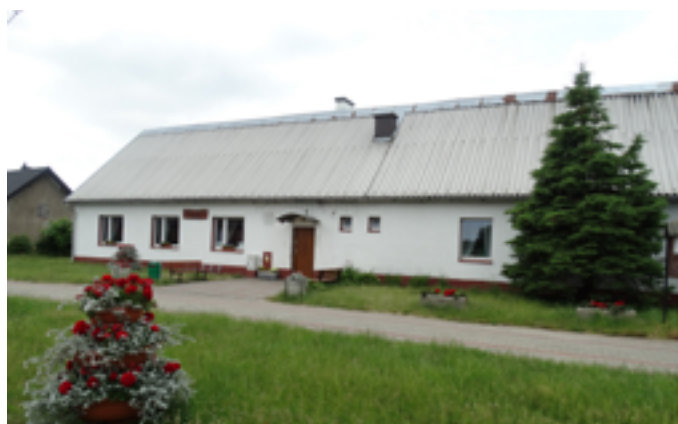
Kategoria Wieś-I miejsce - Kaczkowo