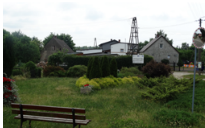
Kategoria Wieś-I miejsce - Kaczkowo