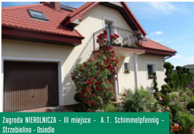
Zagroda NIEROLNICZA - III miejsce - A.T. Schimmelpfennig - Strzebielino - Osiedle