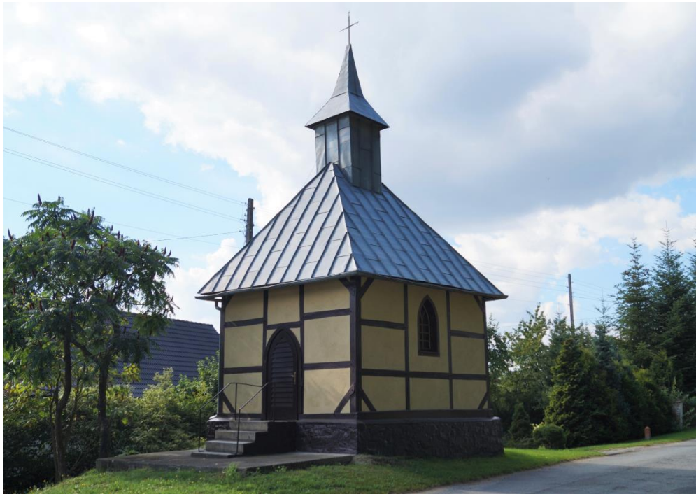
Kaplica modlitewna, obecnie rzymskokatolicka kaplica mszalna pw. św. Jana Nepomucena