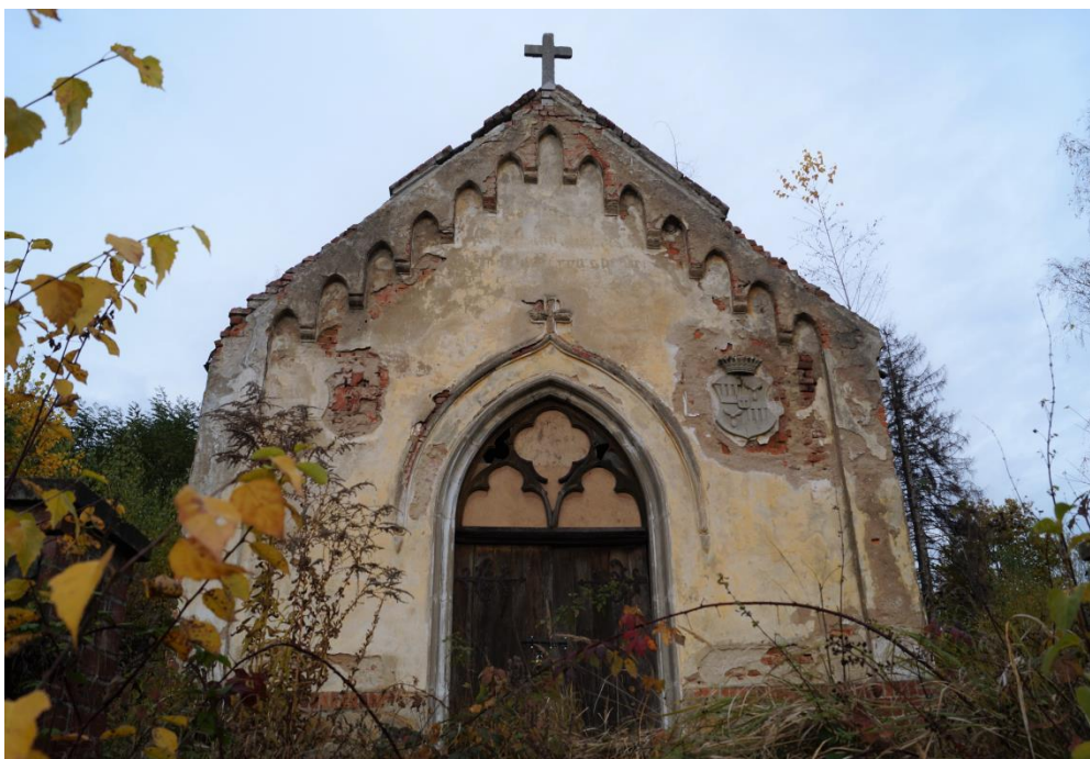
Mauzoleum rodowe rodziny von der Recke-Volmersteinna cmentarzu ewangelickim