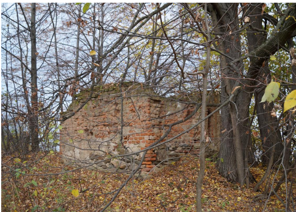
Kapliczka przydrożna (ruina)