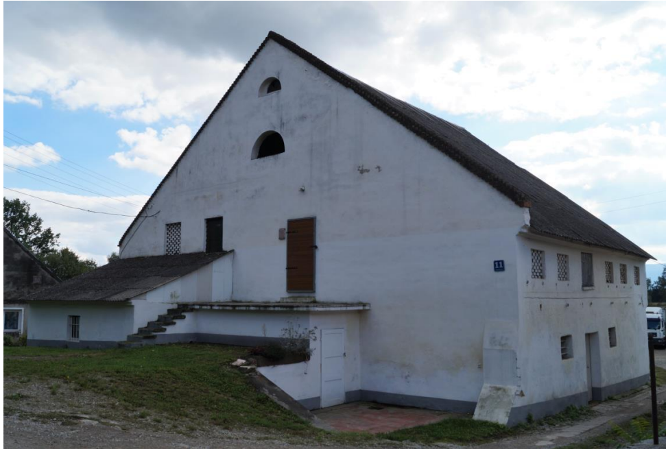
Budynek gospodarczy w zespole młyna