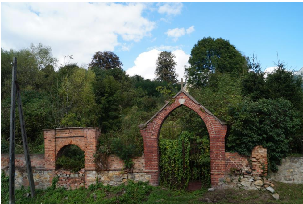
Zespół cmentarza ewangelickiego