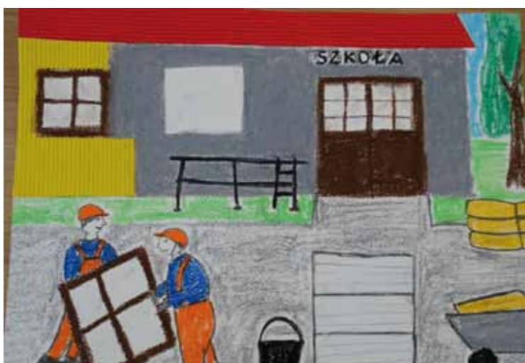
Autor: Jeremiasz Cyganek