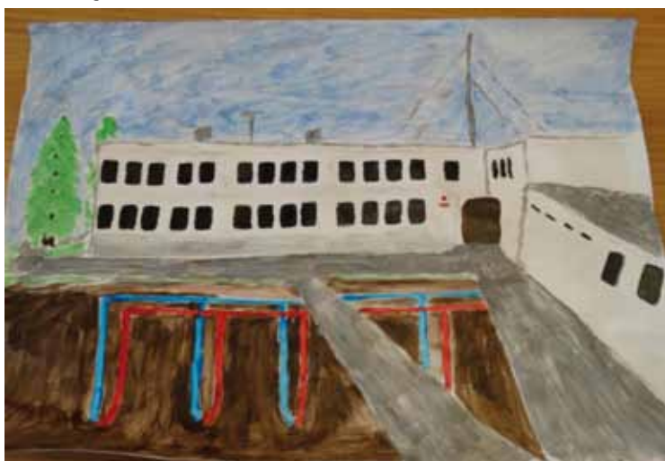
Autor: Jakub Zieleniewski