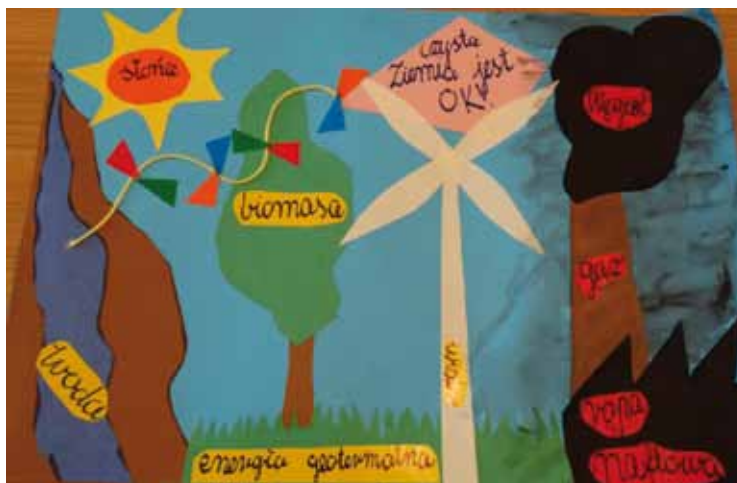
Autor: Agata Hebel