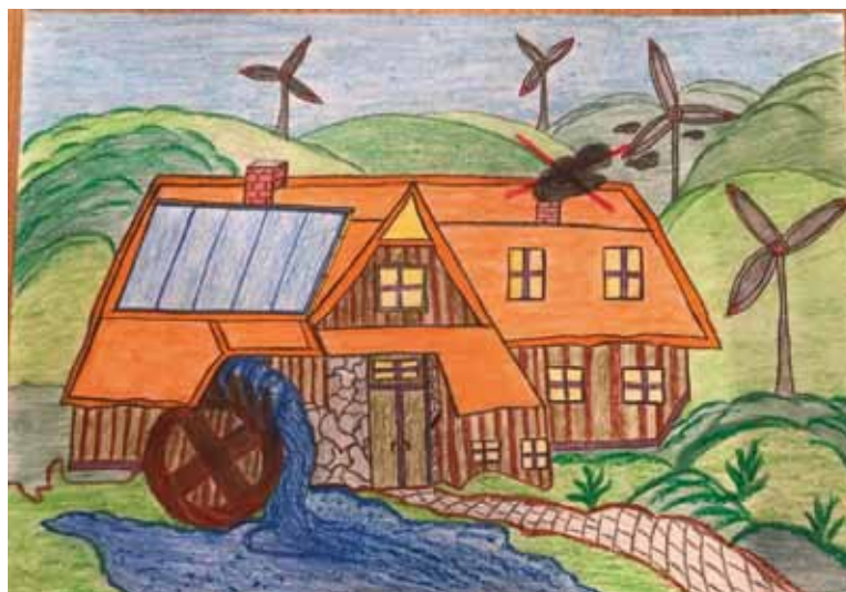
Autor: Mikołaj Borski