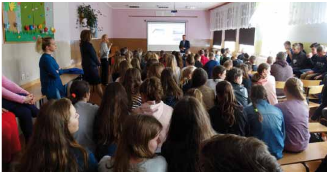
Miejsce prelekcji – ZS Bożepole Wielkie