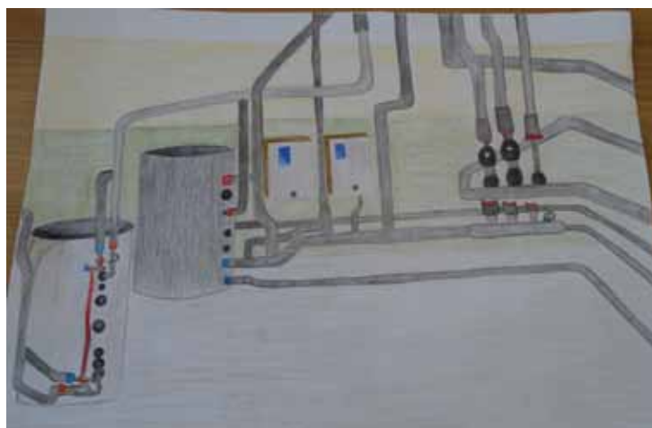
Autor: Kinga Chołody

Projekt współfinansowany z Europejskiego Funduszu Rozwoju Regionalnego w ramach Regionalnego Programu Operacyjnego Województwa Pomorskiego na lata 2014-2020