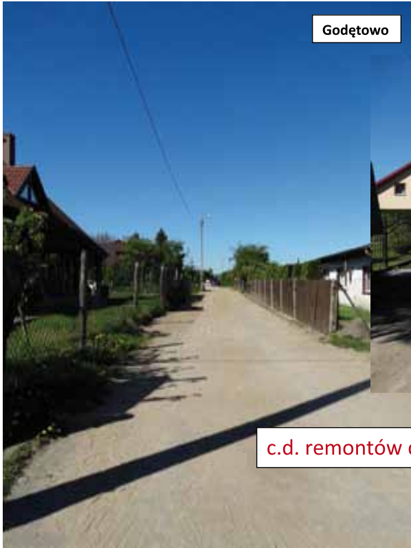
ul. Słoneczna - Łęczycze