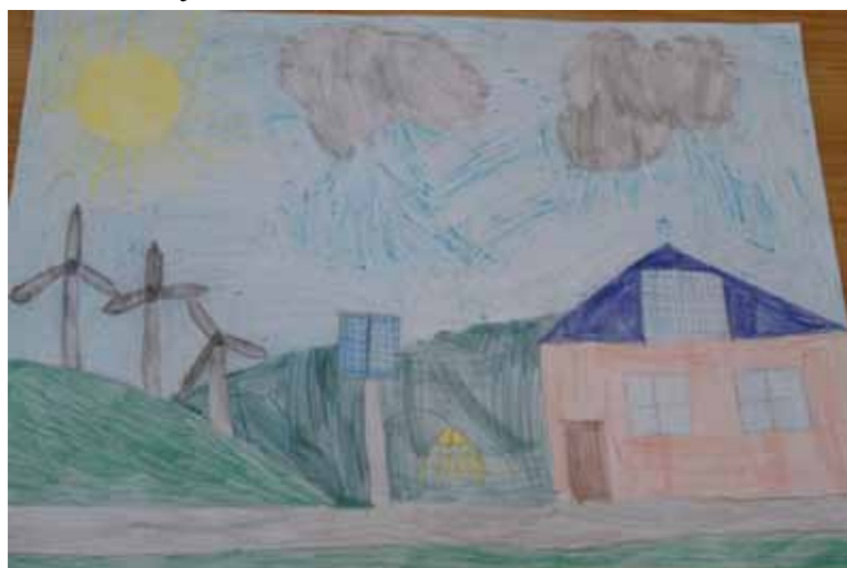
Autor: Agata Stolz