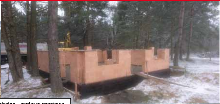
Rozłazino – zaplecze sportowe