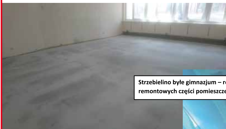
Strzebielino było gimnazjum – rozpoczęcie prac remontowych części pomieszczeń na cele sołeckie