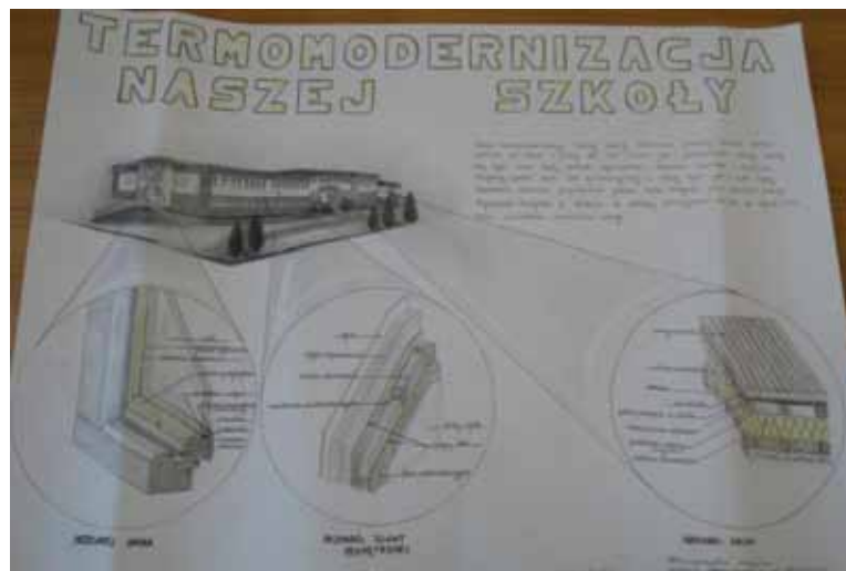
Autor: Natalia Kominacka