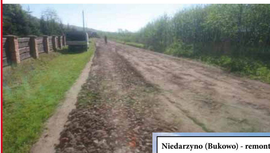
Niedarzyno (Bukowo) - remont fragmentu drogi gminnej