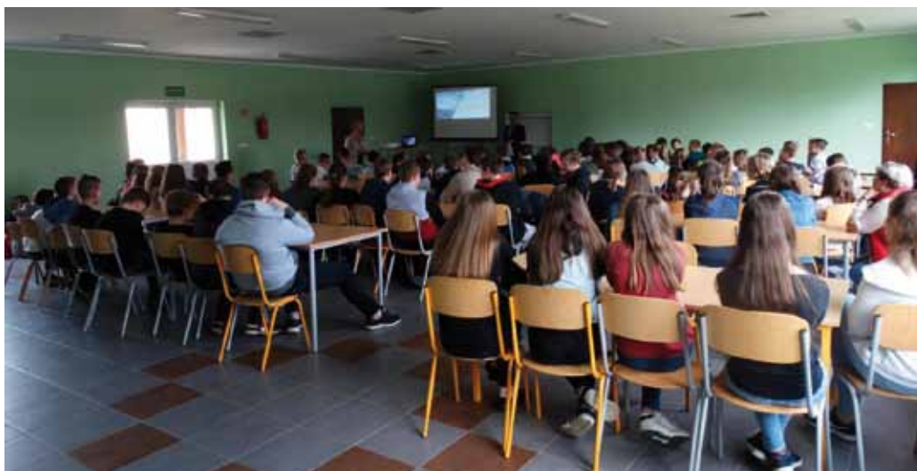
Miejsce prelekcji – ZSiP Strzebielino

Projekt współfinansowany z Europejskiego Funduszu Rozwoju Regionalnego w ramach Regionalnego Programu Operacyjnego Województwa Pomorskiego na lata 2014-2020