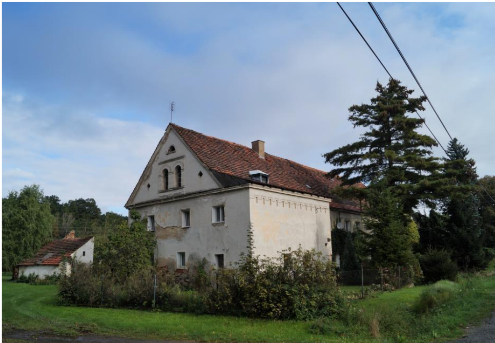
Zespół zagrody dóbr kmiących