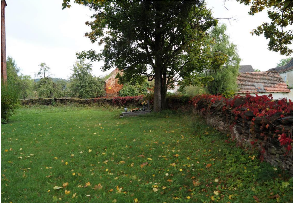
Cmentarz przy rzymskokatolickim kościele filialnym pw. Ducha Świętego