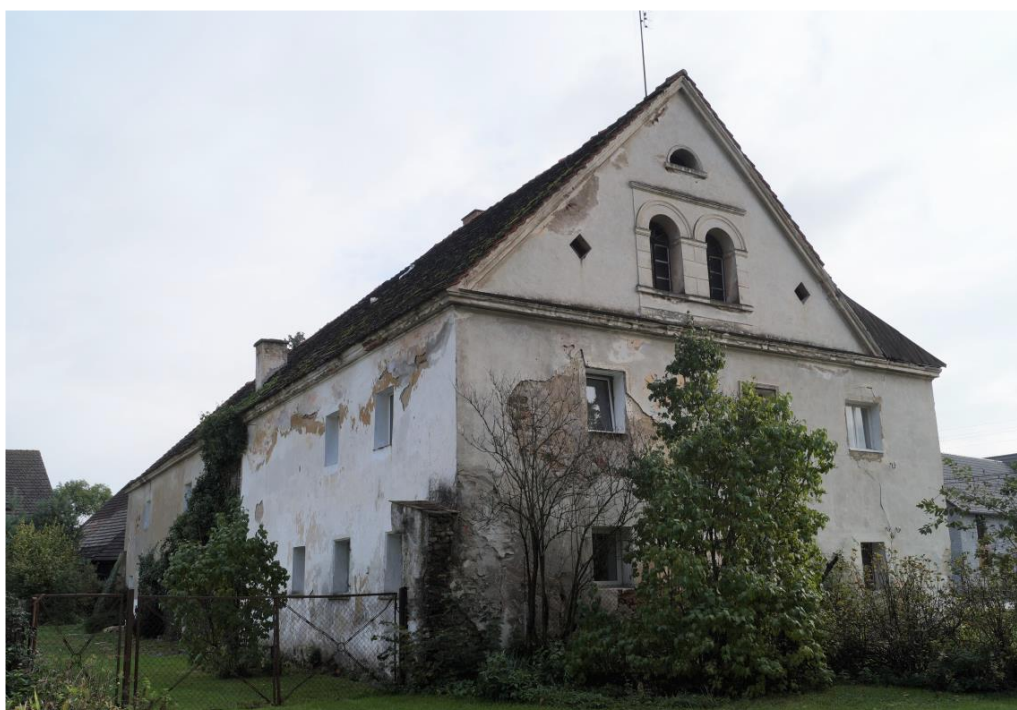
Dwór w zespole zagrody dóbr kmiących, obecnie dom mieszkalny