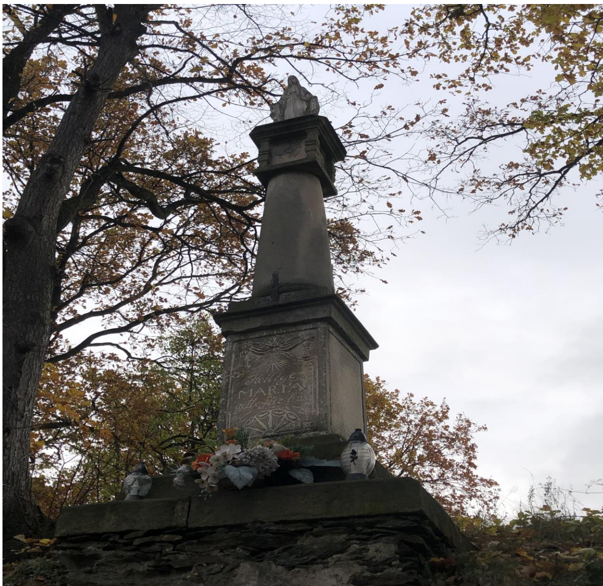
Kolumna Maryjna na wzgórzu