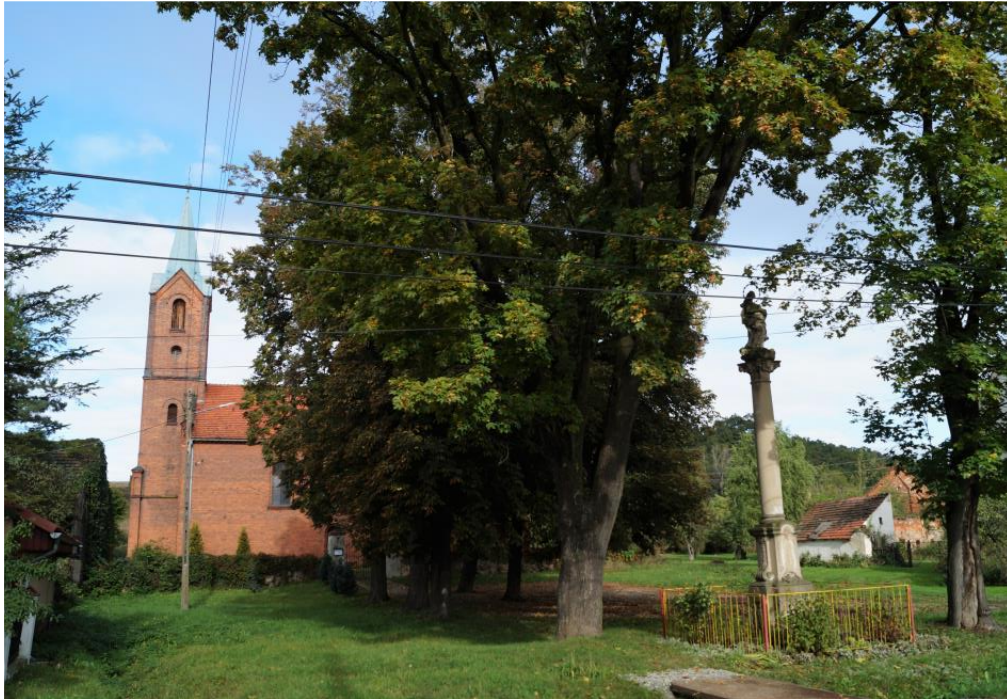
Zespół rzymskokatolickiego kościoła filialnego pw. Ducha Świętego