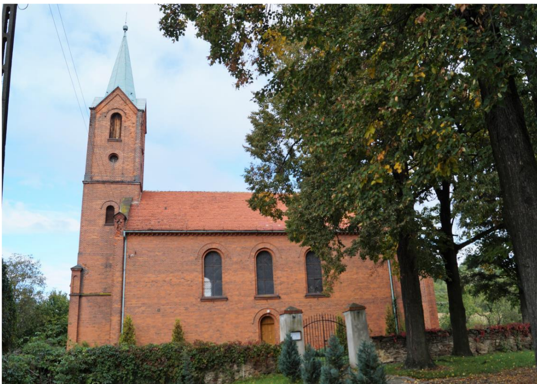
Zespół rzymskokatolickiego kościoła filialnego pw. Ducha Świętego