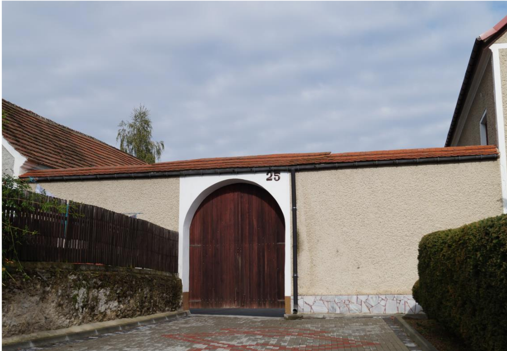
Ściana kurtynowa z bramą