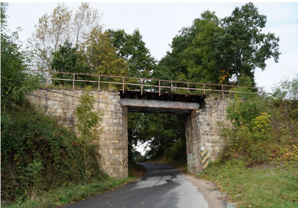
Wiadukt wąskotorowej linii kolejowej Kamieniec Ząbkowicki – Złoty Stok