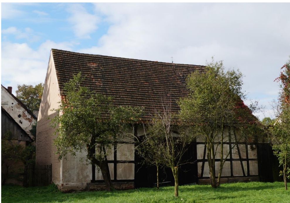
Stodoła w zespole zagrody dóbr kmiących