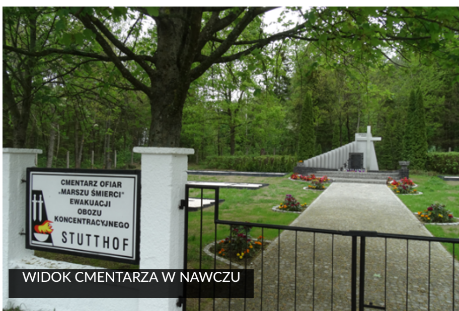
WIDOK CMENTARZA W NAWCZU

uroczyste otwarcie połączone z 25 rocznicą konsekracji kościoła w Nawczu. Do tej pory mamy nadzieję zahodować piękną zielenią i kwiatami na cmentarzu.