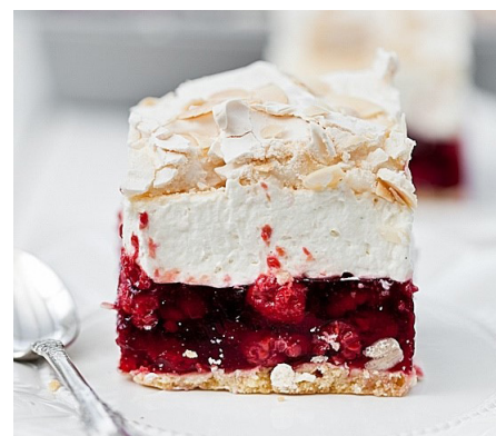
Ciasto wstawiamy na kilka godzin do lodówki.

Żelatynę dokładnie rozpuszczamy w gorącej przegotowanej wodzie i studzimy. Miksujemy na sztywno śmietanę z cukrem, następnie dodajemy serka mascarpone. Na koniec wlewamy ostudzoną żelatynę. Całość dokładnie miksujemy i wykładamy na galaretkę. Na wierzch kładziemy bezę.