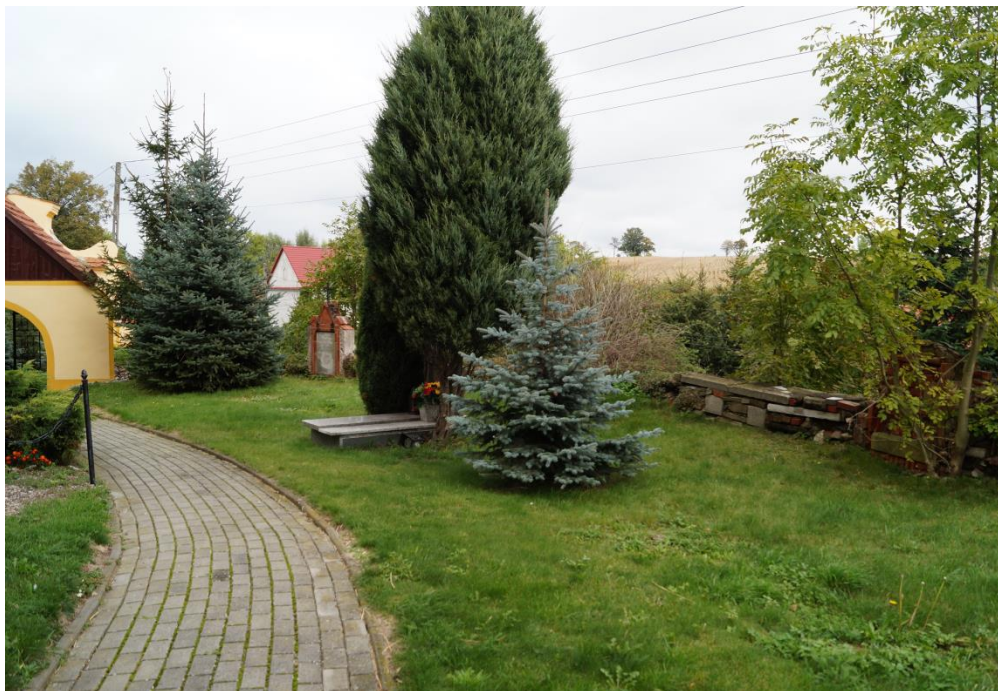
Cmentarz przy rzymskokatolickim kościele filialnym pw. św. Maternusa