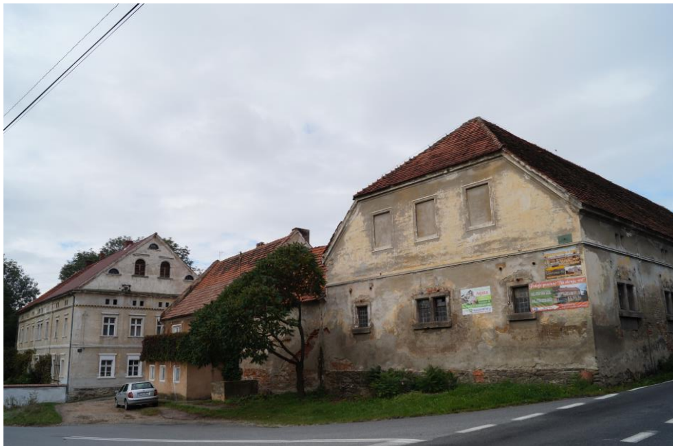
Zespół folwarku sołeckiego