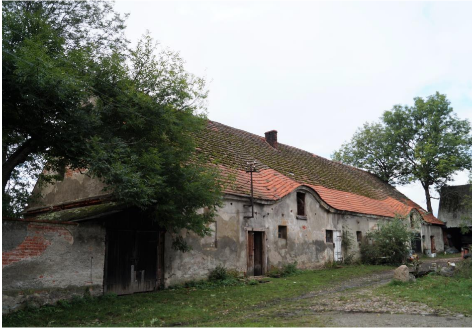
Budynek gospodarczy w zespole folwarku sołeckiego