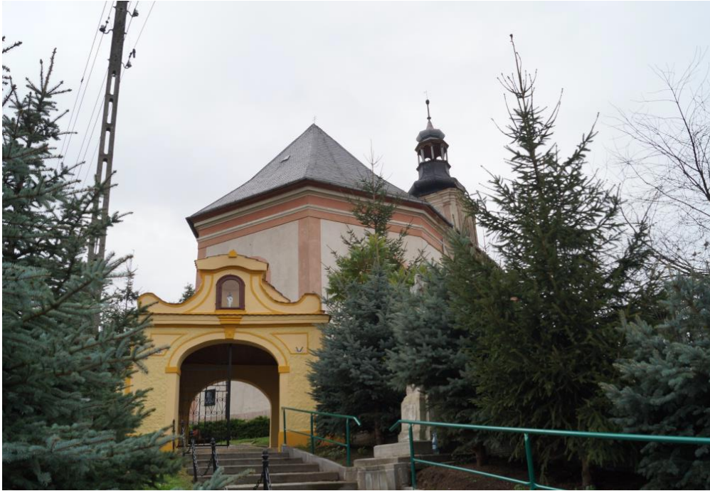
Zespół rzymskokatolickiego kościoła filialnego pw. św. Maternusa