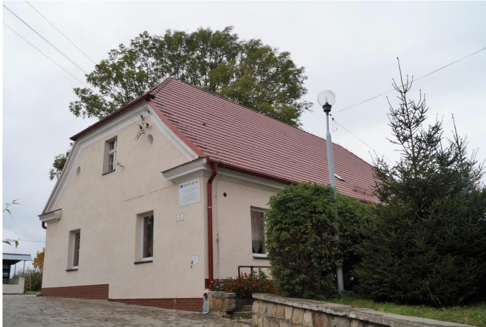
Szkoła w zespole rzymskokatolickiego kościoła filialnego pw. św. Maternusa, obecnie świetlica wiejska