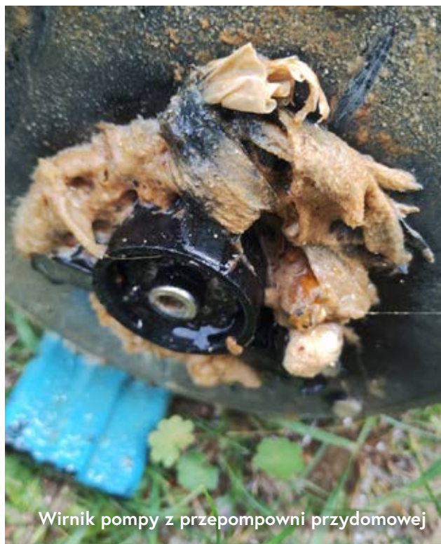
Wirnik pompy z przepompowni przydomowej

Kanalizacja sanitarna to nie kosz na śmieci i nie można do niej wrzucać wszystkiego, co chcemy. Wrzucanie do toalety przedmiotów, które nigdy nie powinny się tam znaleźć, może doprowadzić do poważnych awarii, takich jak: cofnięcia ścieków i zalanie domu, ogrodu lub ulicy. Takie zjawisko powoduje duże straty materialne, jest uciążliwe dla mieszkańców oraz bardzo szkodliwe dla środowiska naturalnego. Dodatkowo koszty napraw i części zamiennych do urządzeń kanalizacyjnych są wliczane do taryfy zwiększając cenę za 1 m 3 ścieków.