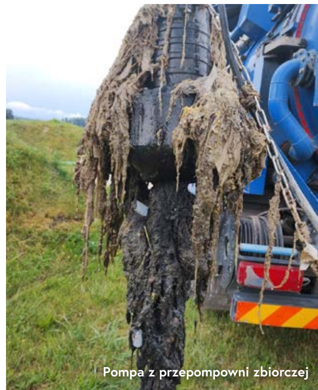
Pompa z przepompowni zbiorczej