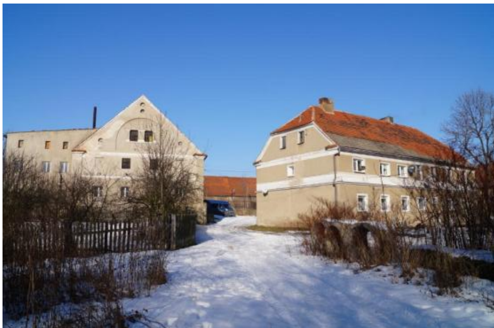
Zespół folwarku sołeckiego przy ul. Jasnej