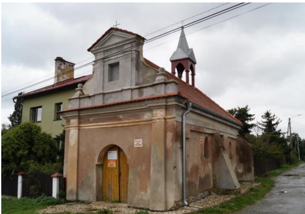
Kaplica przy ul. Leśnej