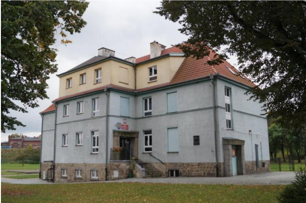
Szkoła Podstawowa nr 2 im. Papieża Jana Pawła II w Kamieńcu Ząbkowickim