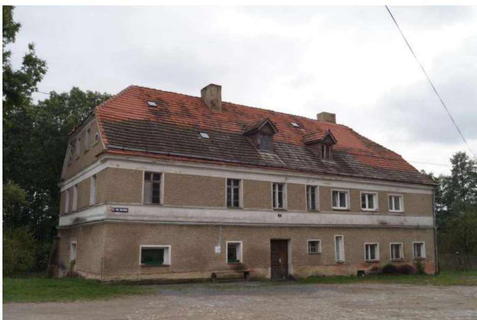
Dom mieszkalny w zespole folwarku sołeckiego