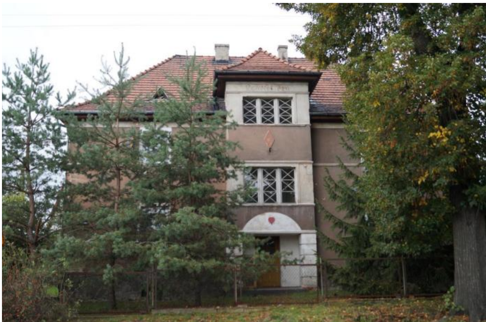
Dom mieszkalny wybudowany ok. 1910r.