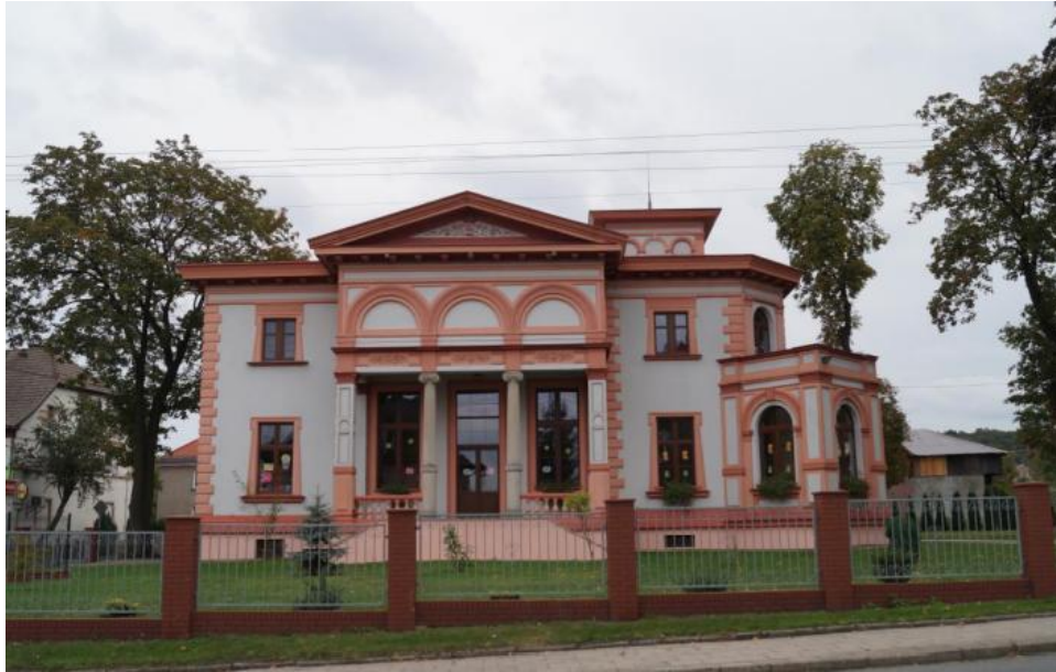
Przedszkole Publiczne nr 2