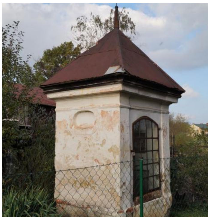
Kapliczka przydrożna przy ul. Krętej