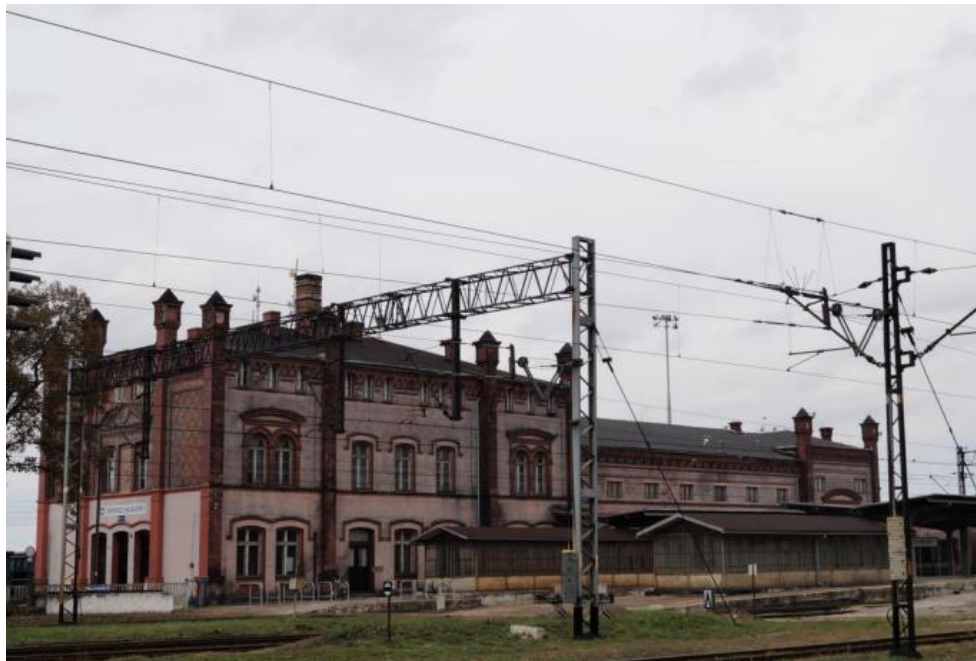
Dworzec kolejowy w zespole stacji kolejowej Kamieniec Ząbk.