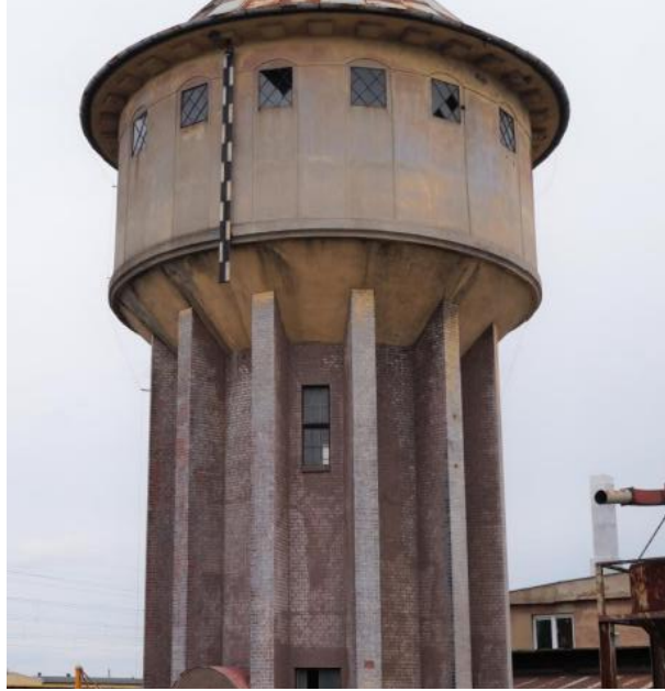
Wieża ciśnien II w zespole stacji kolejowej Kamieniec Ząbk.