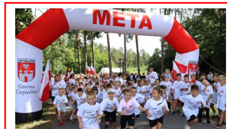
I Bieg Pamięci Żołnierzy 74 GPP pod Dąbrową