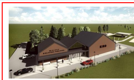
Projekt Miejskiego Centrum Kultury w Ciepiałowie