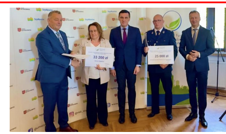
Kolejne dofinansowania gminnych inwestycji