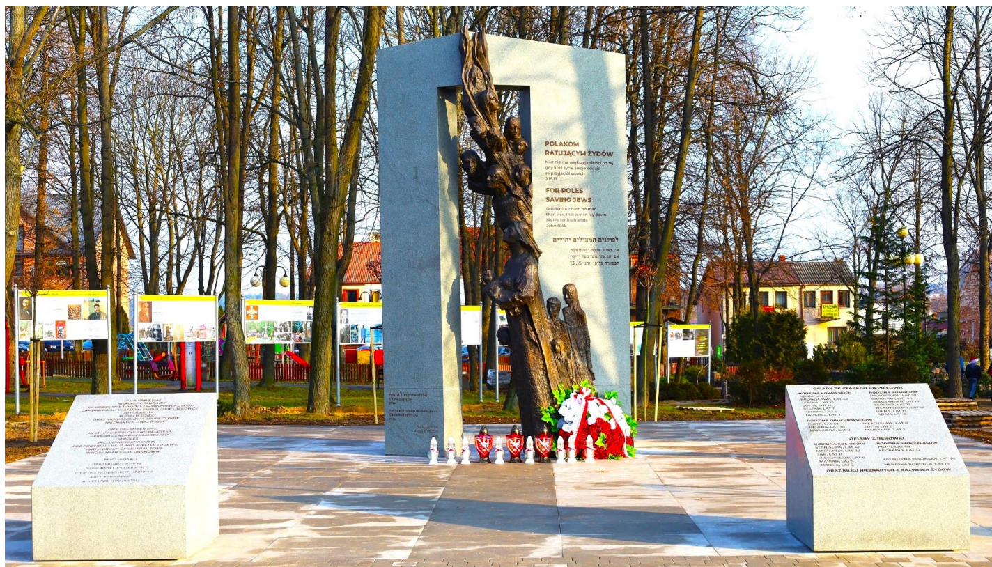
Pomnik dla Polaków ratujących Żydów – pierwsze takie upamiętnienie w Polsce

www.ciepielow.pl e-mail: gmina@ciepielow.pl