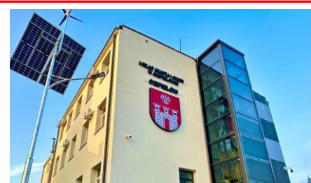
Nowe lampy hybrydowe