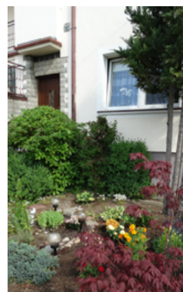
Zagroda NIEROLNICZA - WYRÓŻNIENIE - Elżbieta Gajewska , Strzebielino-Osiedle