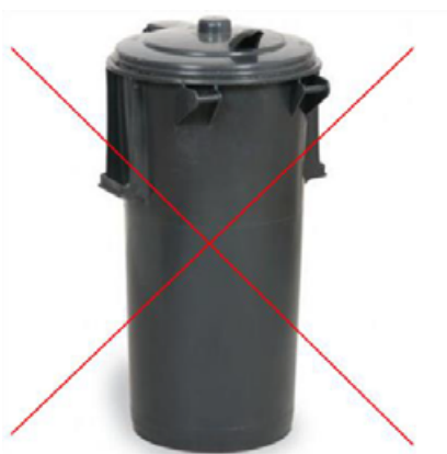
Ryc. 2 Przykładowy pojemnik NIESPEŁNIAJĄCY NORM

Strzałka wskazuje miejsce, gdzie pojemnik powinien być oznakowany polską normą oraz maksymalnym obciążeniem.