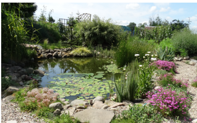
Zagroda NIEROLNICZA - III miejsce - Aldona i Zbigniew Witt , Jeżewo