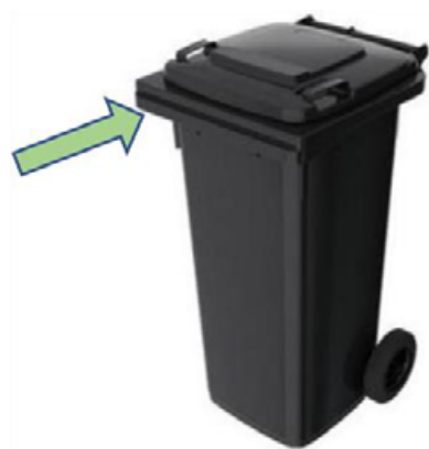
Ryc. 1 Przykładowy pojemnik, który posiada charakterystyczny kołnierz/chwytek i będzie współpracował z pojazdami specjalistycznymi.

• są wykonane są z PEHD – polietylenu niskociśnieniowego wysokiej gęstości, co zapewnia odpowiednią jakość. Pojemniki takie są odporne m.in. na uszkodzenia mechaniczne.