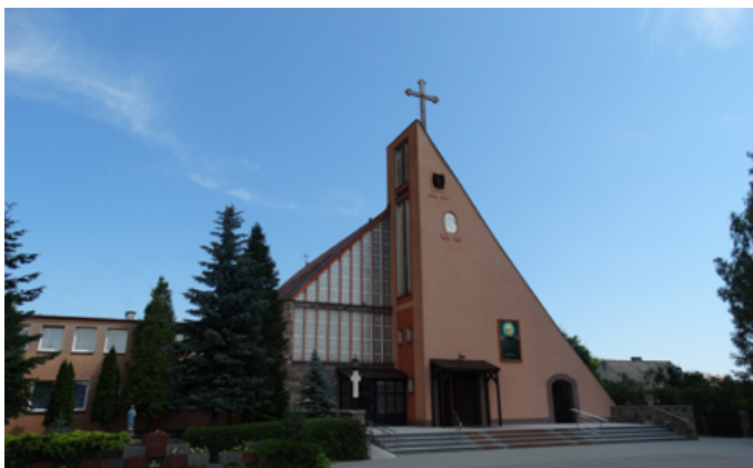
Kategoria WIEŚ - WYRÓŻNIENIE - Strzebielino-Osiedle