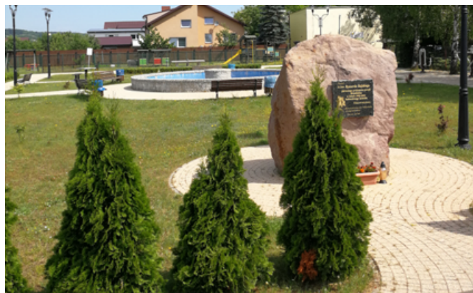
Kategoria WIEŚ - WYRÓŻNIENIE - Strzebielino-Osiedle