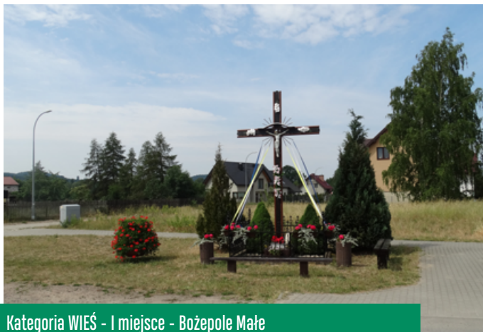
Kategoria WIEŚ - I miejsce - Bożepole Małe