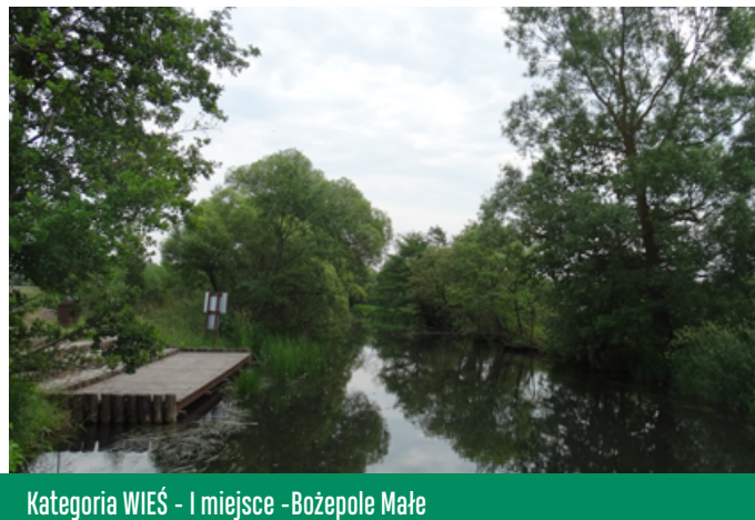
Kategoria WIEŚ - I miejsce - Bożepole Małe