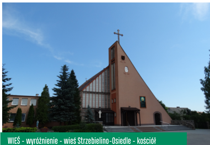
WIEŚ - wyróżnienie - wieś Strzebielino-Osiedle - kościół