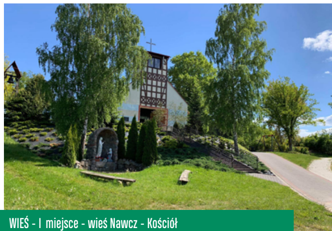
WIEŚ - I miejsce - wieś Nawcz - Kościół