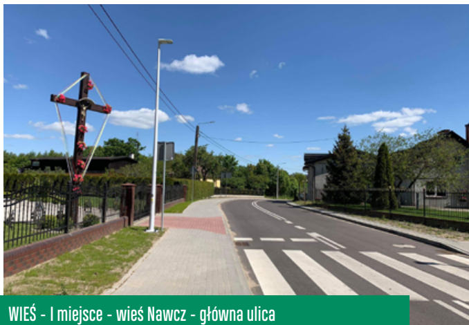
WIEŚ - I miejsce - wieś Nawcz - główna ulica