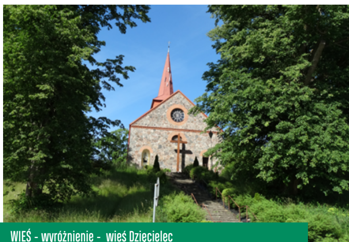
WIEŚ - wyróżnienie - wieś Dzięciolec