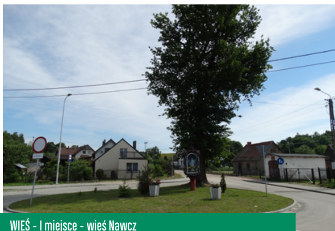
WIEŚ - I miejsce - wieś Nawcz