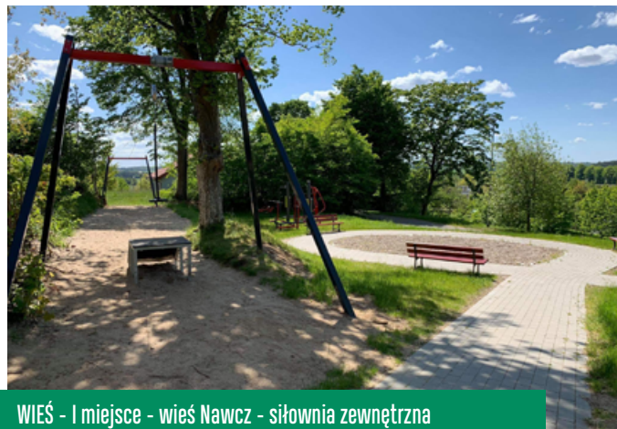
WIEŚ - I miejsce - wieś Nawcz - siłownia zewnętrzna