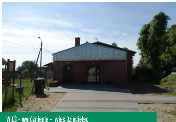
WIEŚ - wyróżnienie - wieś Dzięciolec