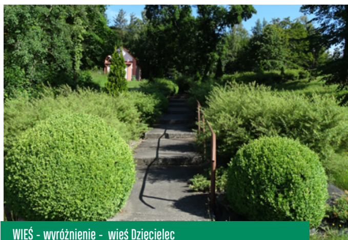
WIEŚ - wyróżnienie - wieś Dzięciolec