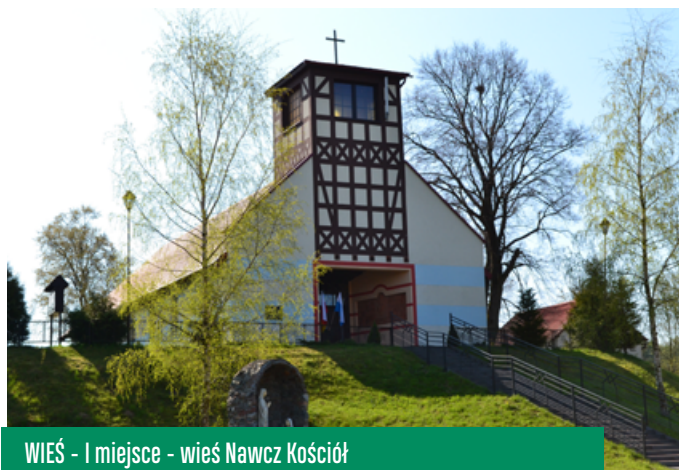
WIEŚ - I miejsce - wieś Nawcz Kościół