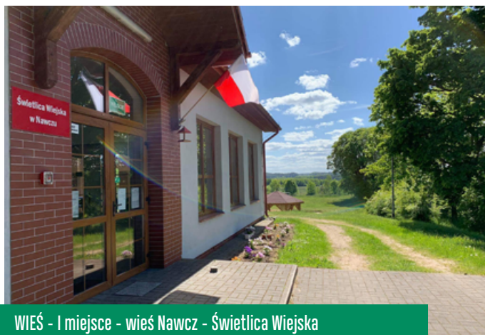
WIEŚ - I miejsce - wieś Nawcz - Świątelnia Wiejska