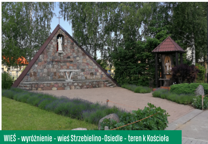
WIEŚ - wyróżnienie - wieś Strzebielino - Osiedle - teren k Kościoła