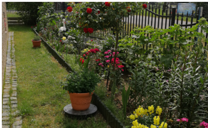
Zagroda NIEROLNICZA - wyróżnienie - Regina Żywicka Kisewo