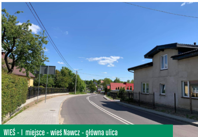
WIEŚ - I miejsce - wieś Nawcz - główna ulica