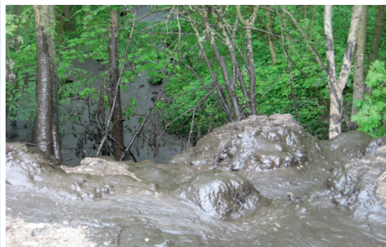
Szlam wylany do wąwozu