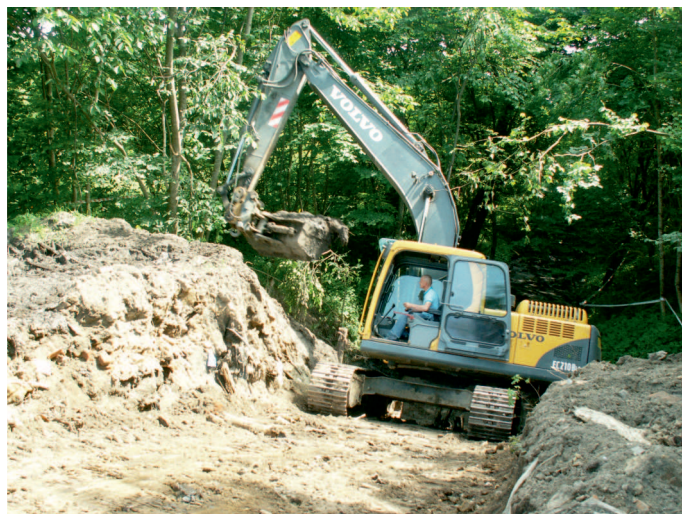
W trakcie prac