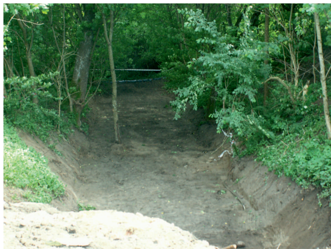
Wąwóz po uprzątnięciu

Sprawa, o której było głośno od 19 maja 2014r. dobiega końca. Fakty w sprawie są następujące: