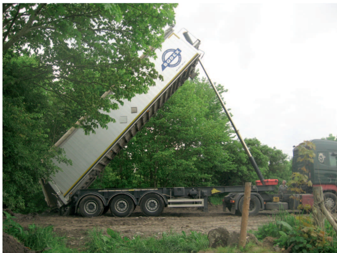
W trakcie zaśmiecania terenu