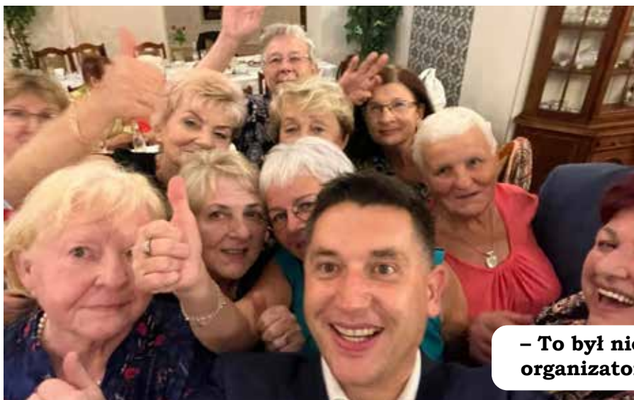
- To był niezapomniany wieczór! Dziękujemy organizatorom i prosimy o więcej.