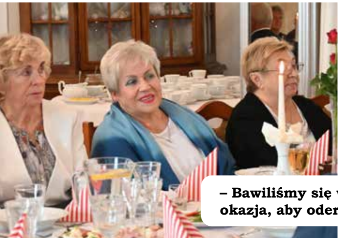
- Bawiliśmy się wspaniale, to doskonała okazja, aby oderwać się od codziennych trosk.