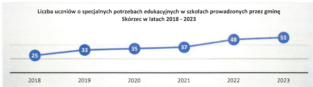
Wykres nr 6. Liczba uczniów z niepełnosprawnościami w szkołach w latach 2018 - 2023