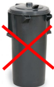
Przykładowy pojemnik niespełniający norm

Ponadto w przypadku, kiedy pojemnik niespełniający norm jest uszkodzony, istnieje duże prawdopodobieństwo, że podczas wywozu wpadnie on do komory śmieciarki lub nie będzie możliwości żeby go opróżnić. Aby tego uniknąć należy niezwłocznie wymienić niewłaściwe pojemniki.