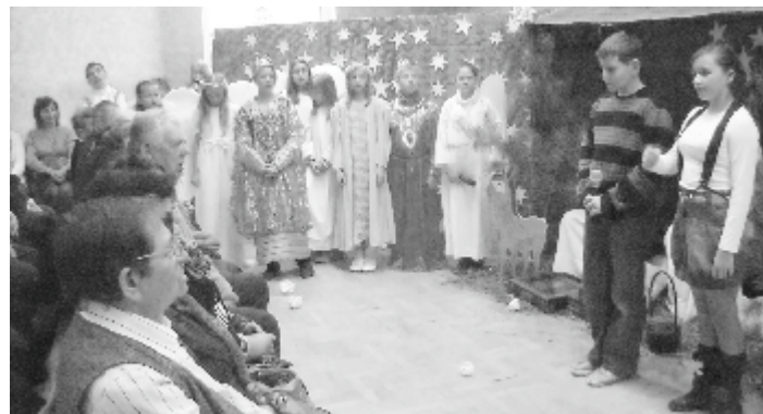
M. Kaliński