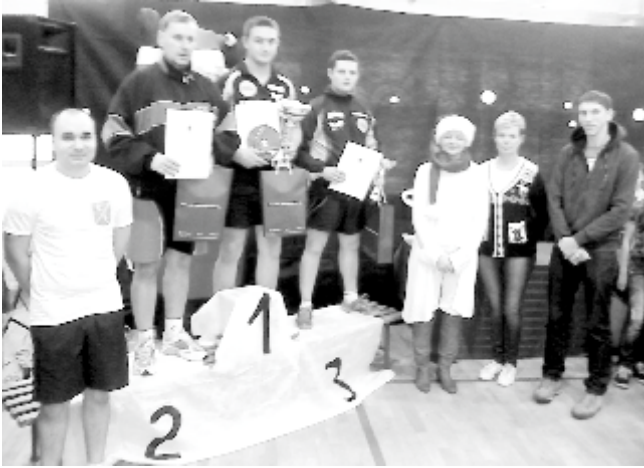
Mistrzowie kategorii otwartej