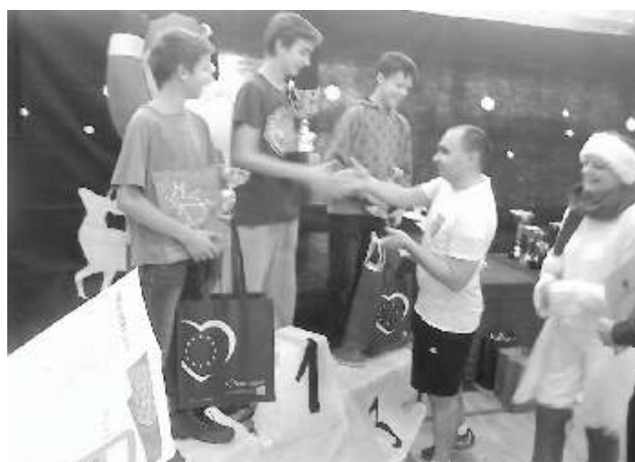
Mistrzowie szkoły podstawowej