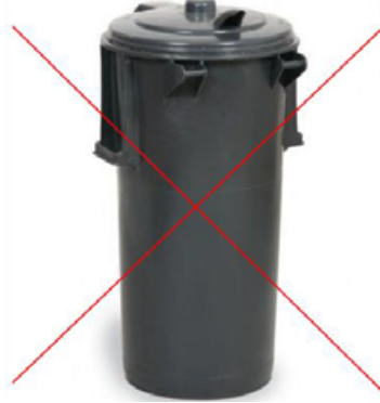
Ryc. 2 Przykładowy pojemnik NIE SPEŁNIAJĄCY NORM

Strzałka wskazuje miejsce, gdzie pojemnik powinien być oznakowany polską normą oraz maksymalnym obciążeniem