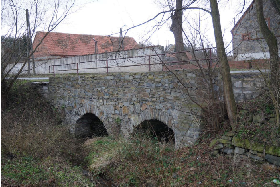
Most drogowy nad potokiem Młynówka Grzmiąca