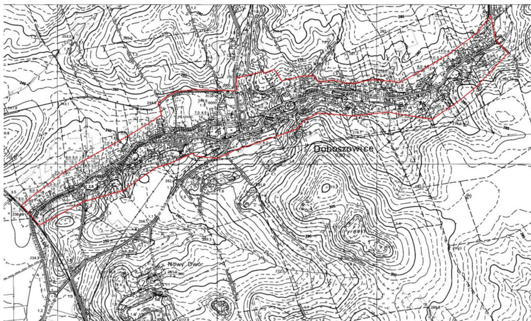
Historyczny układ ruralistyczny wsi Doboszowice