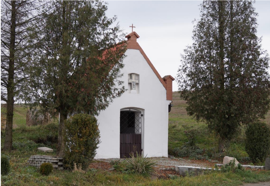
Kapliczka przydrożna z 2 połowy XIXw.