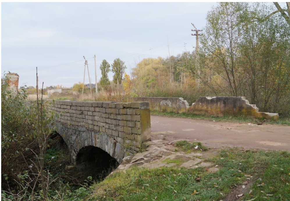
Most między zespołem pałacowo-folwarcznym a folwarkiem Owczym nad potokiem Młynówka Grzmiąca