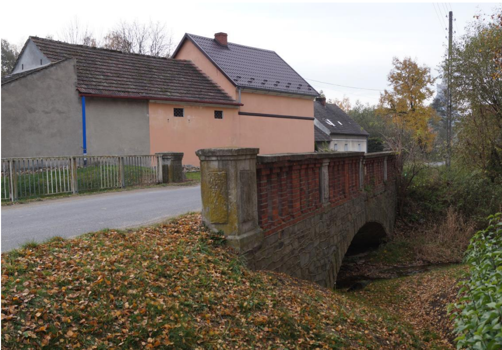
Most drogowy nad potokiem Młynówka Grzmiąca