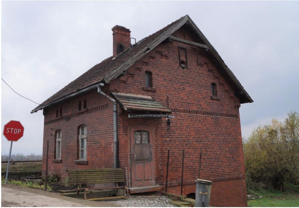
Dom dróżnika przy linii kolejowej z ok. 1894r.