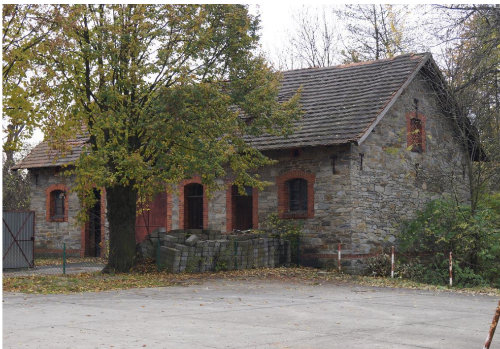
Budynek gospodarczy przy plebanii rzymskokatolickiego kościoła parafialnego pw. św. Mikołaja ok. 1910r.