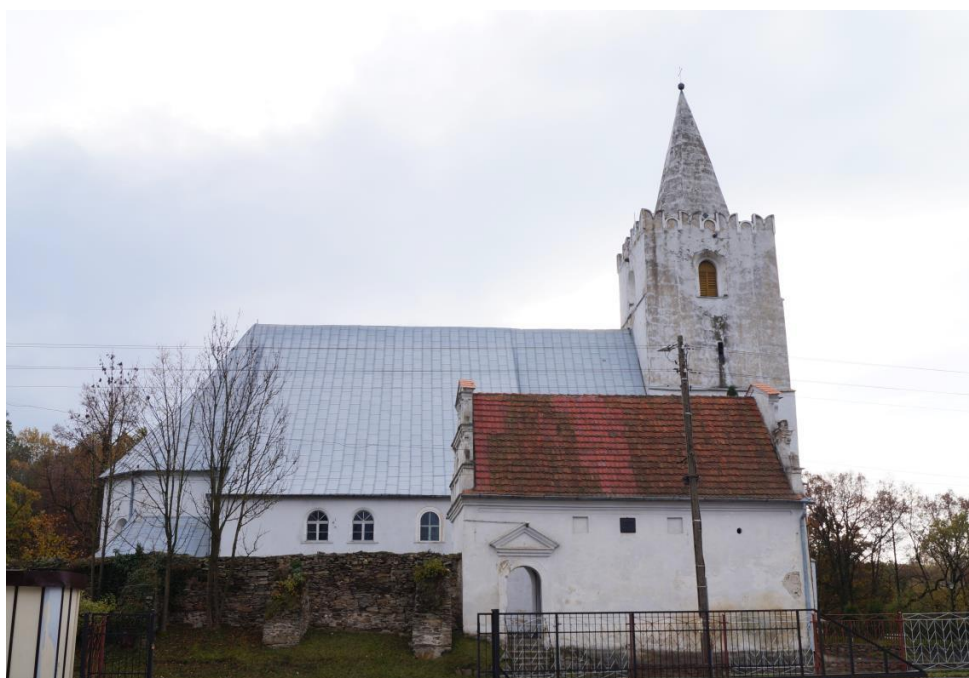
Rzymskokatolicki kościół parafialny pw. św. Mikołaja