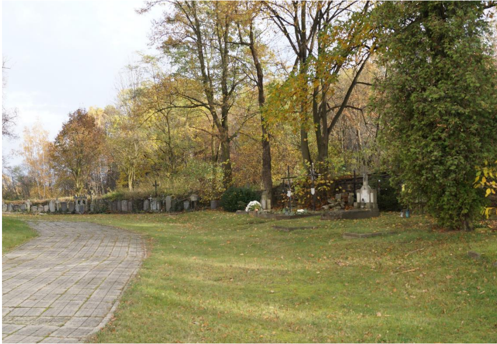
Cmentarz przy rzymskokatolickim kościele parafialnym pw. św. Mikołaja XIVw.