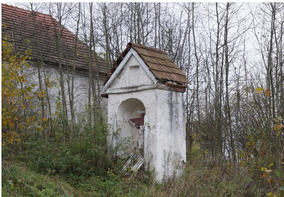
Kapliczka przydrożna z XIX w.