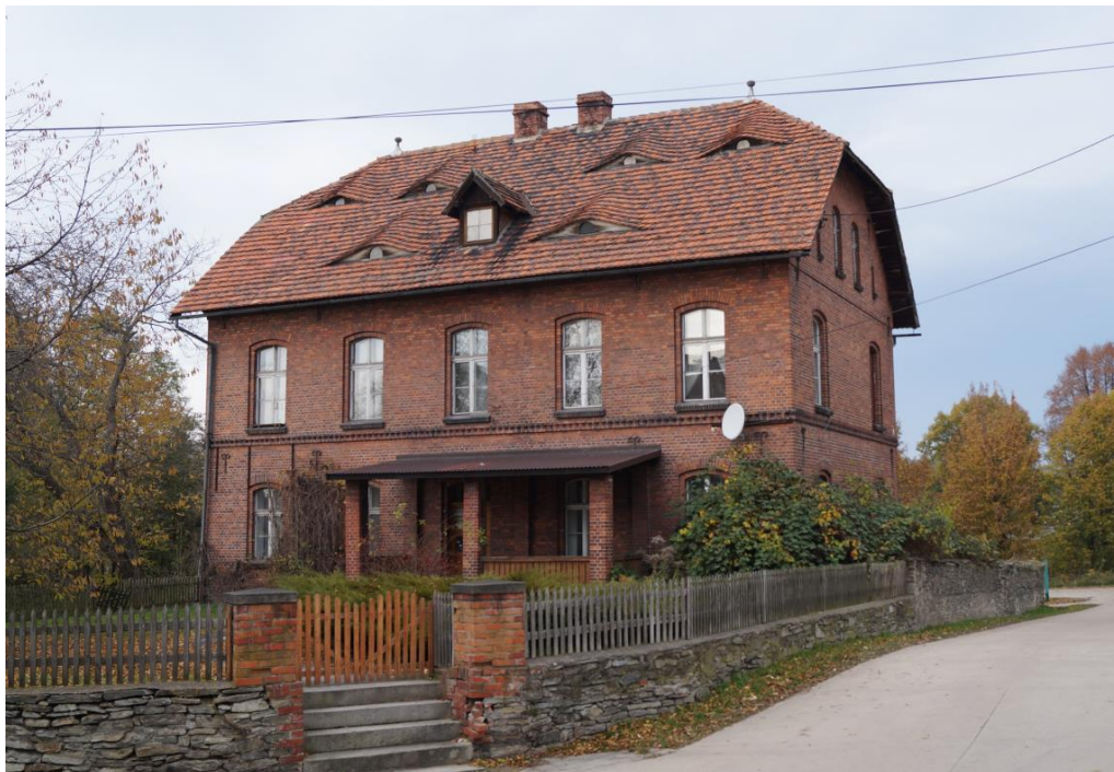
Plebania rzymskokatolickiego kościoła parafialnego pw. św. Mikołaja