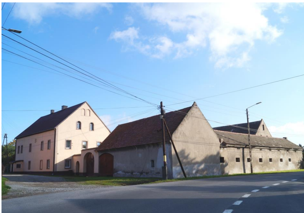
Zespół zagrody 2 poł. XIXw.