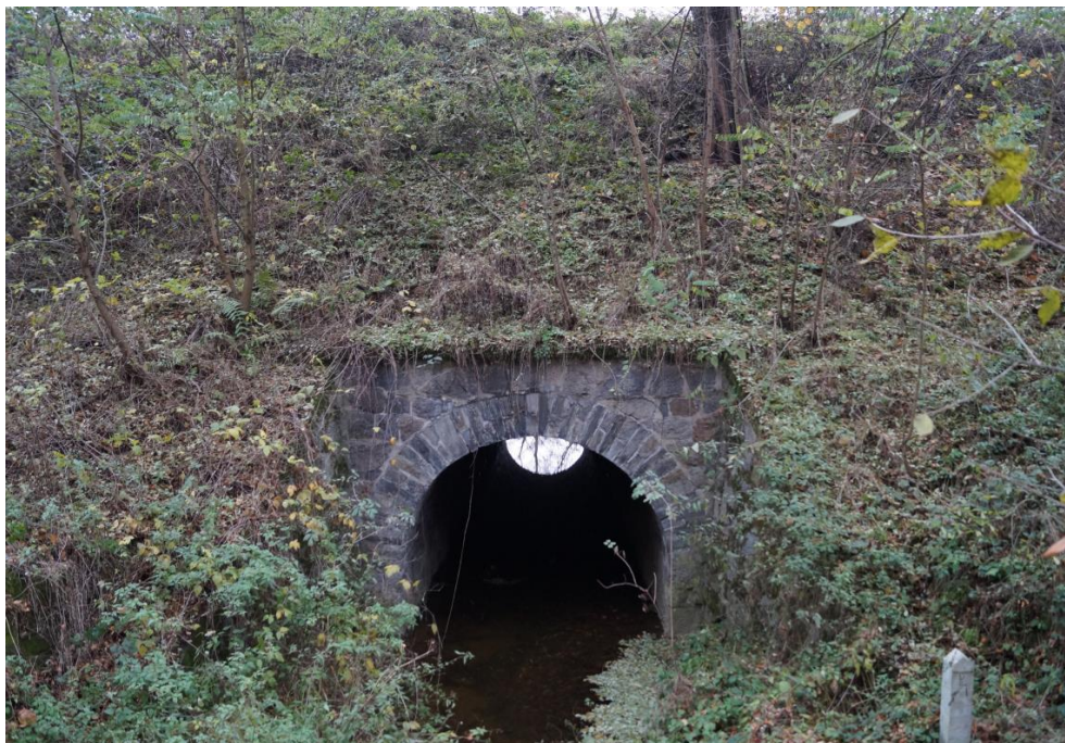
Przepust w nasypie linii kolejowej Wrocław – Międzyzlesie nad potokiem Studew