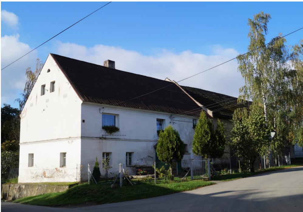
Budynek mieszkalno-gospodarczy ok. poł. XIXw.