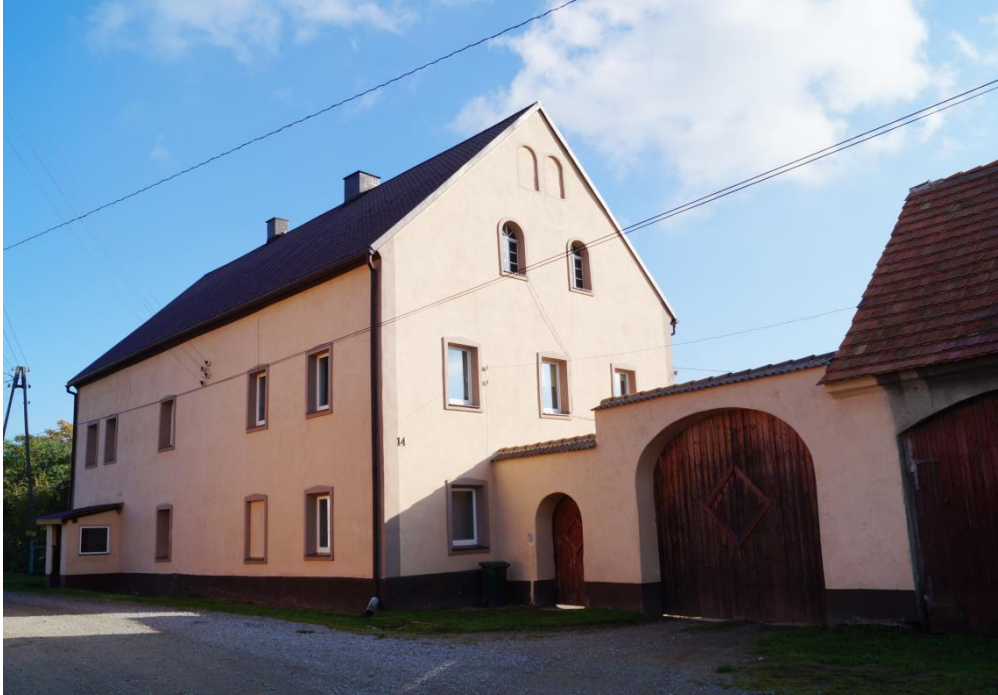
Budynek mieszkalno-gospodarczy z bramą 3 ćw. XIXw.