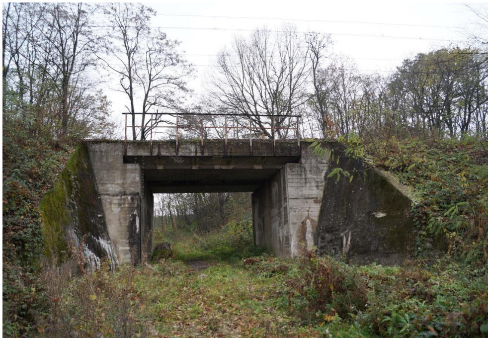
Wiadukt linii kolejowej Wrocław - Międzylesie