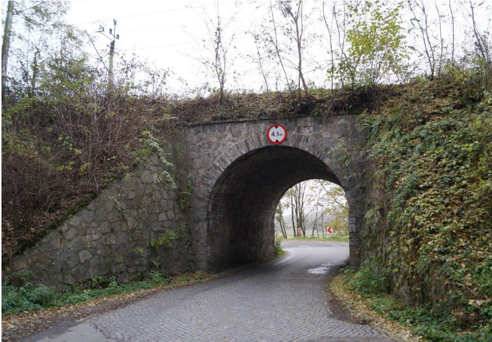
Wiadukt linii kolejowej Wrocław – Międzylesie