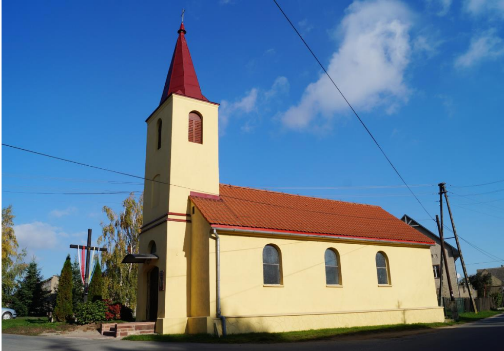
Rzymskokatolicki kościół filialny pw. Matki Boskiej Bolesnej