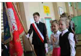
Z życia szkół str.10