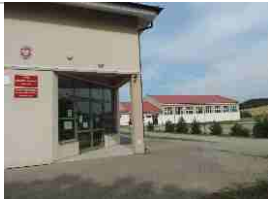
Aktualne inwestycje w Gminie Łęczyce str. 1