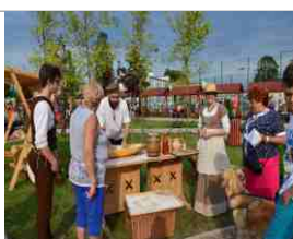
Dożynki Gminne 2015 str.6