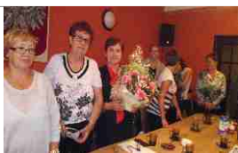
Spotkanie Wyborcze Przedstawicieli GR KGW z terenu Gminy Łęczyce str.5